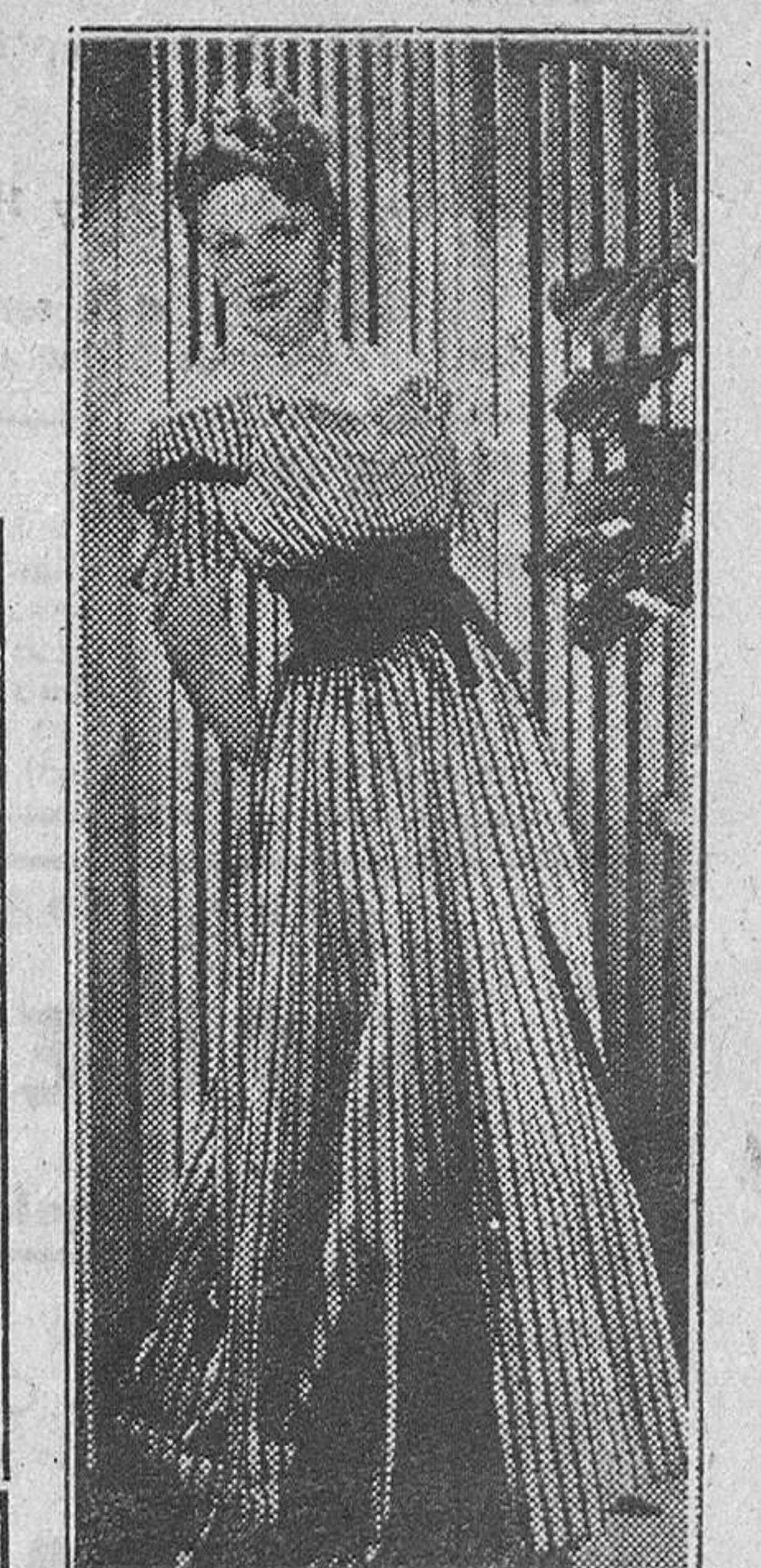
Cientes extranjeros de nuestros modistos

España posee un gran atractivo para el extranjero. Por las bellezas que encierra, por su tradición, por sus monumentos, etc., el extranjero se siente atraído hacia nuestro país. Muchos de los turistas que visitan nuestra patria, tienen como obligada la visita a su modisto preferido. Llevan después esos modelos a su país y, ellos mismos hacen, sin proponérselo, una eficaz propaganda, invitando a sus amistades a que vengan a España. Se dan frecuentes casos de señoras que vienen a nuestro país exclusivamente a vestirse.