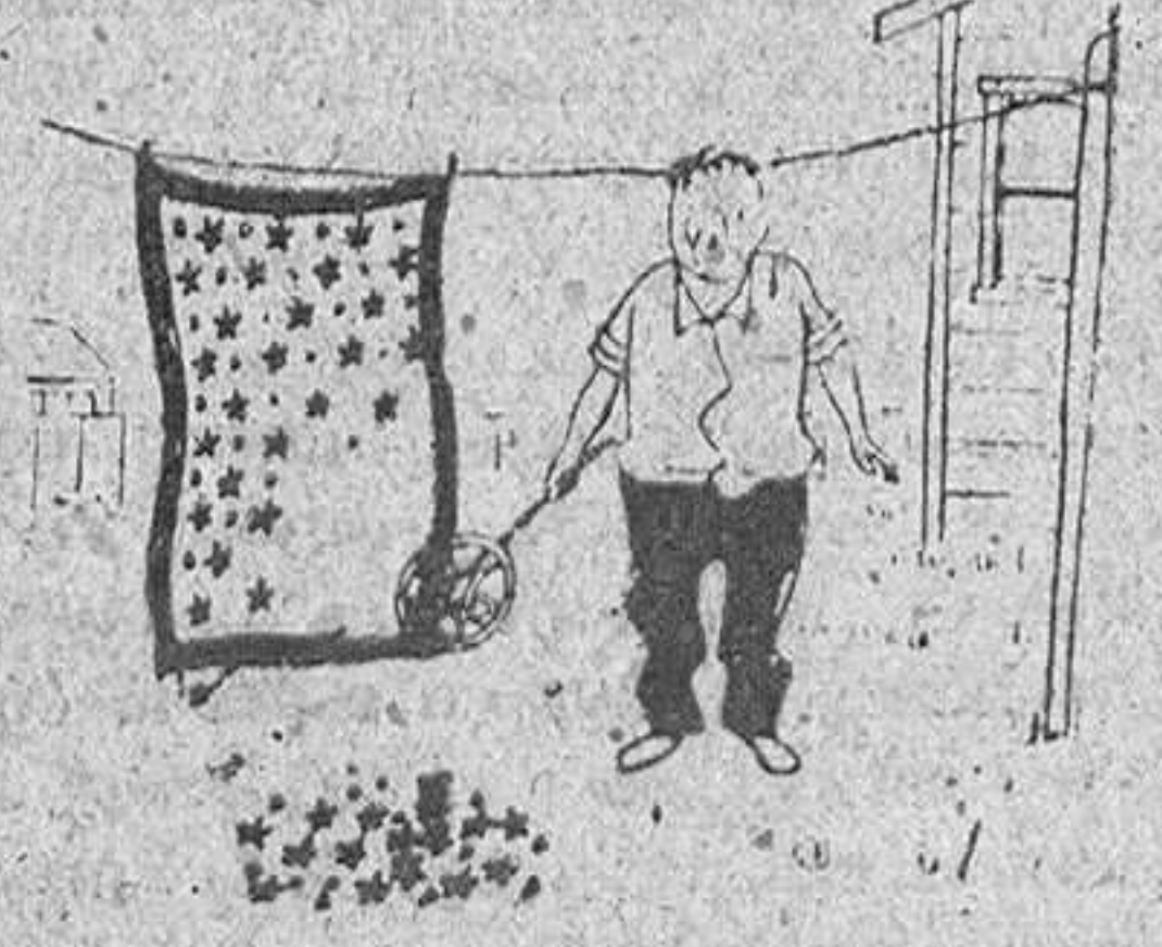
Limpieza «a fondo» de la alfombra.

A los pocos días la niña cumplió su encargo y para retribuir el infantil obsequio la reina le mandó un par de medias de seda, llena la una de bombones y la otra con cierta cantidad de dinero.