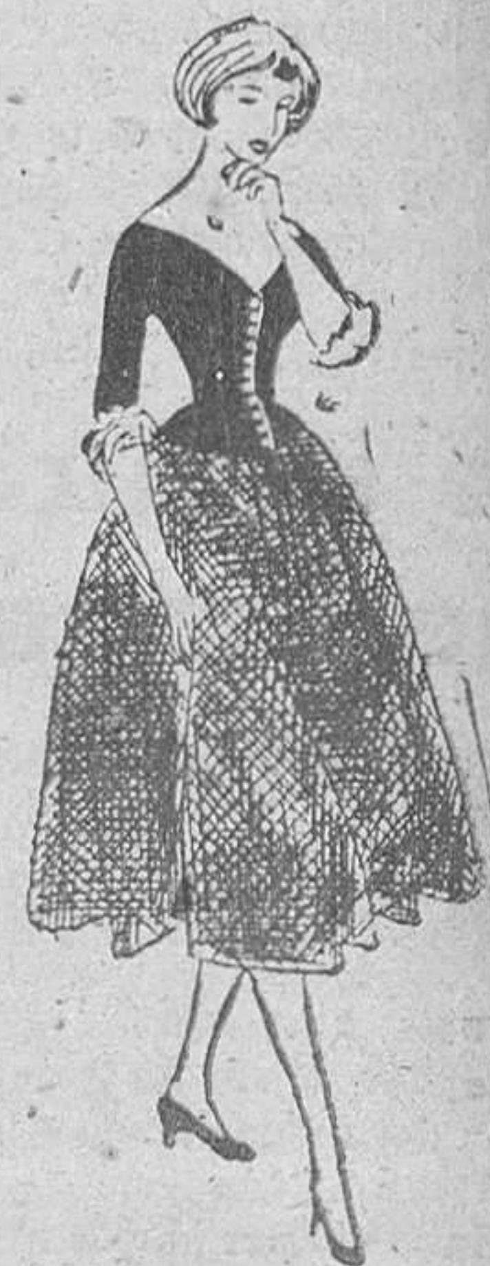
El terciopelo negro formando un corpiño que lleva un escote triangular, mangas tres cuartos y puños terminados en un escajillo fino.