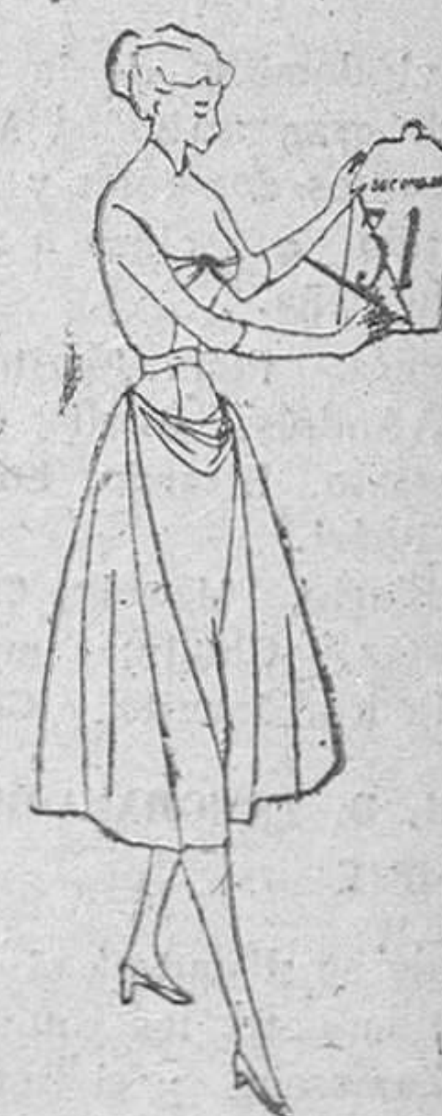
"Jersey" de lana negra y falda recta. El pecho y el delantero de la falda adornado con "taffetas" negro.

VALENCIA, 2.—Ha terminado la Primera Demostración Económica de la región valenciana organizada por la Cámara de Comercio. Han sido visitadas 31 fábricas.