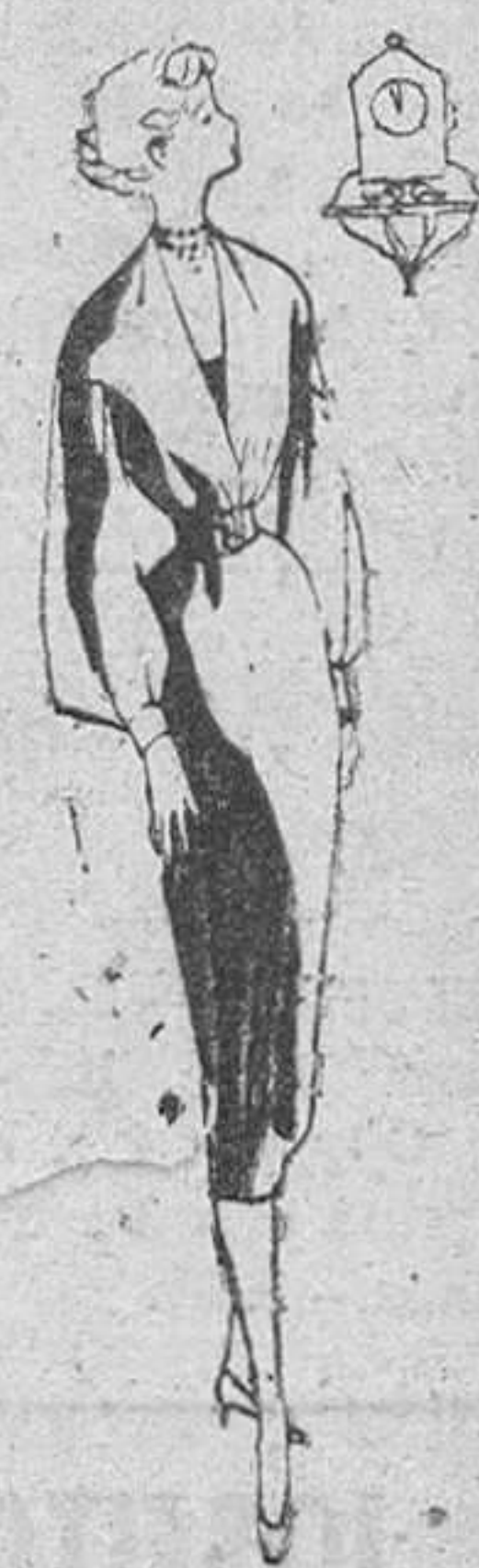
Traje de terciopelo negro, blusa negra de "organdi", muy abierta por delante, mangas anchas de puños estrechos.