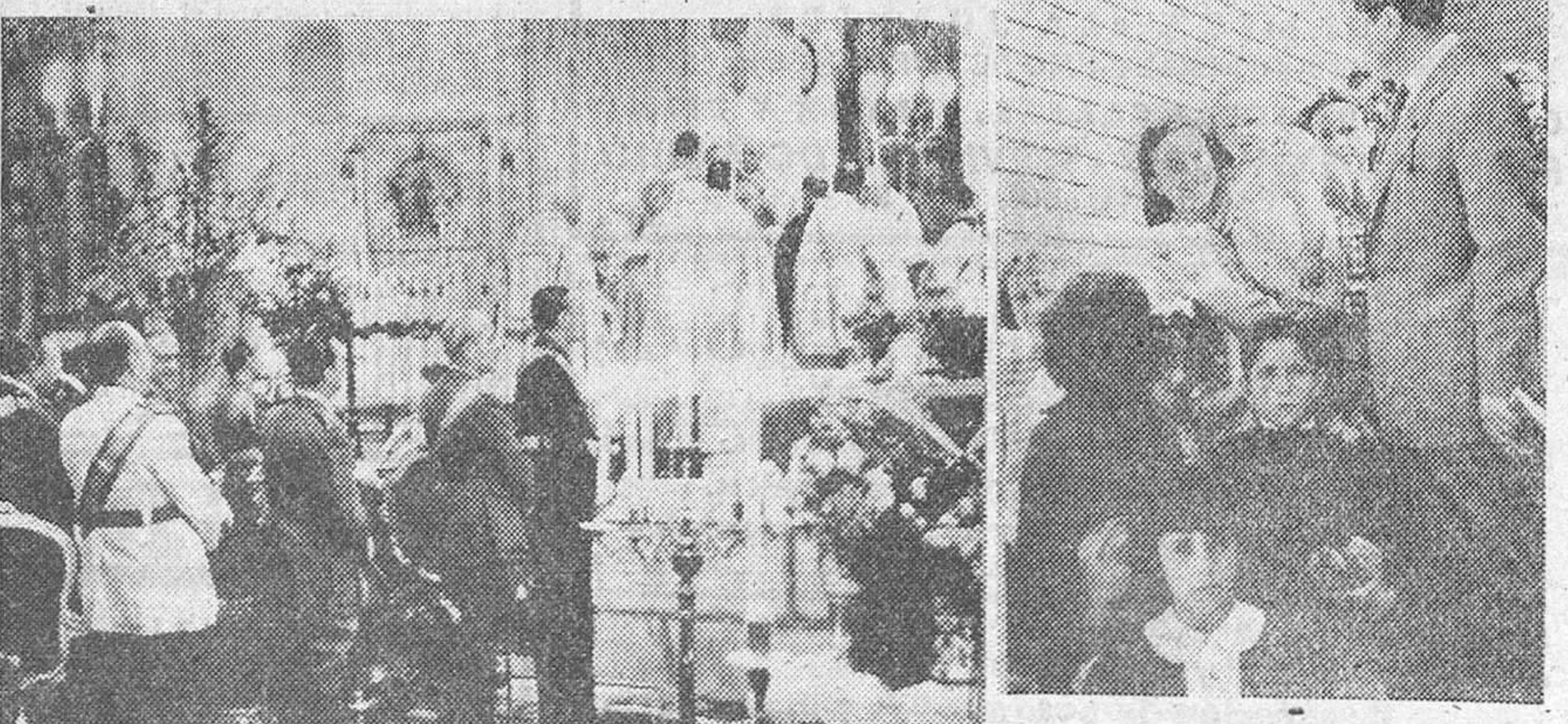
El ministro del Ejército, el de Agricultura y otras autoridades durante el Oficio Mayor celebrado en la Catedral madrileña con motivo de la Fiesta del Santo Patrón de Madrid.