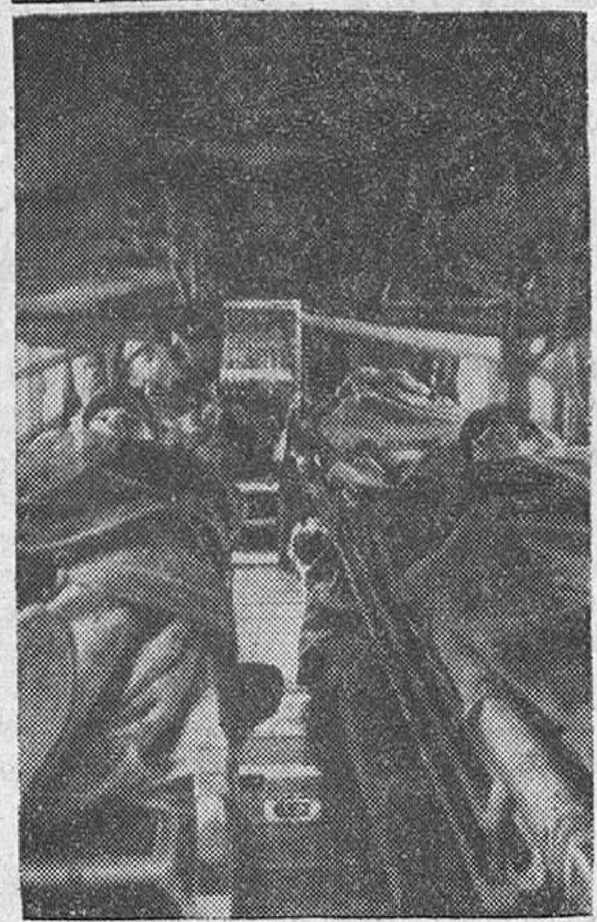
Aspecto interior de un gran avión de transporte alemán habilitado para la conducción de heridos a los hospitales de retaguardia.