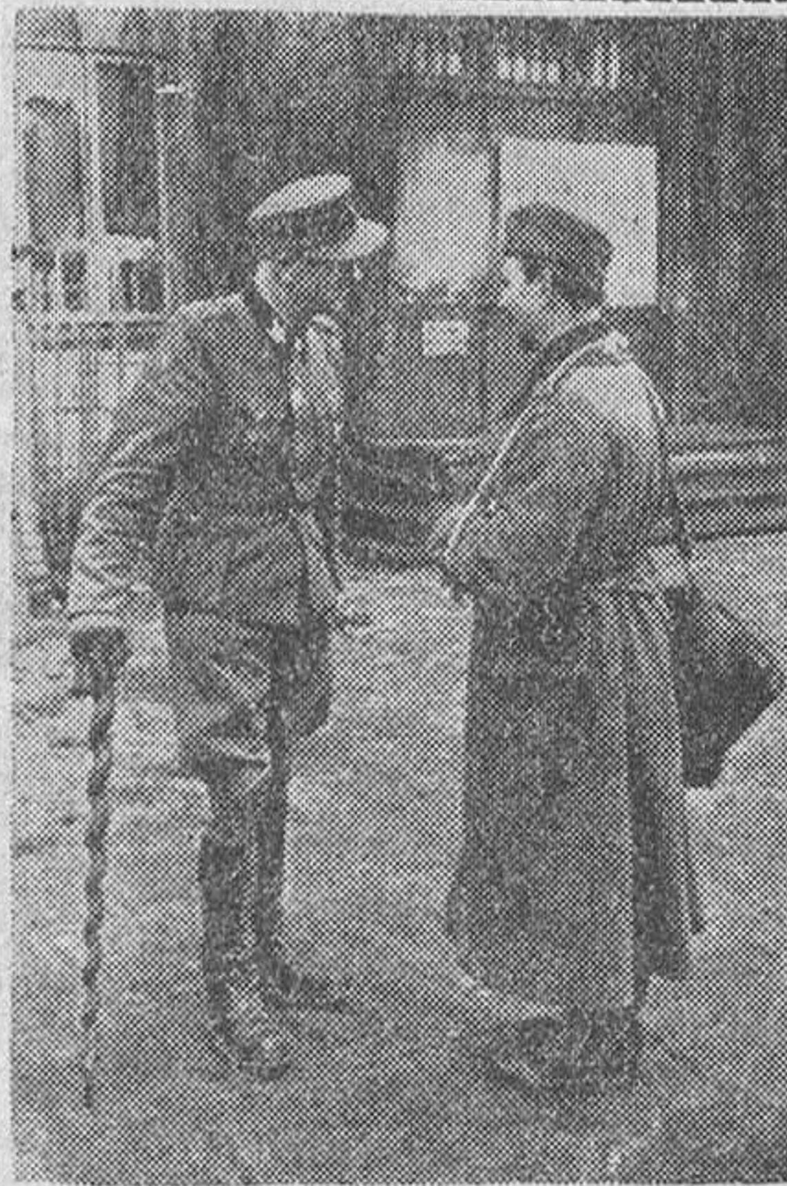
El teniente general de las SS. Gills, conversando con un soldado que fué herido durante los contraataques.

“En los destinos de Europa sólo pueden luchar los que tienen un área común que disputarse”