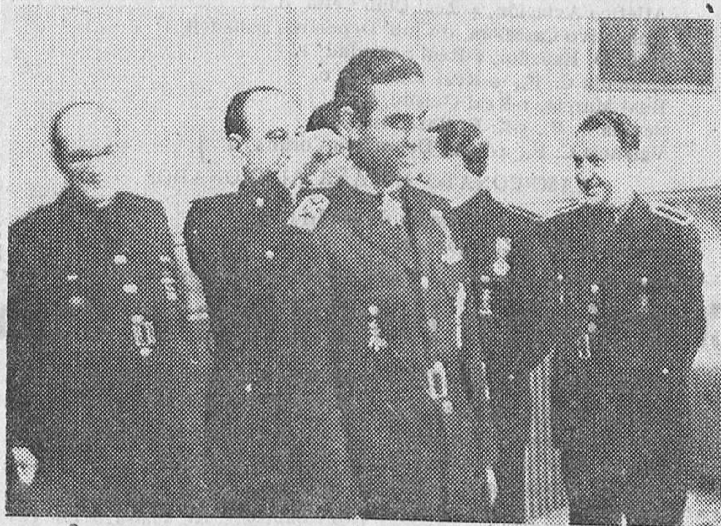
El Ministro Secretario impone la condecoración concedida por el Caudillo al Jefe Provincial de Alicante.