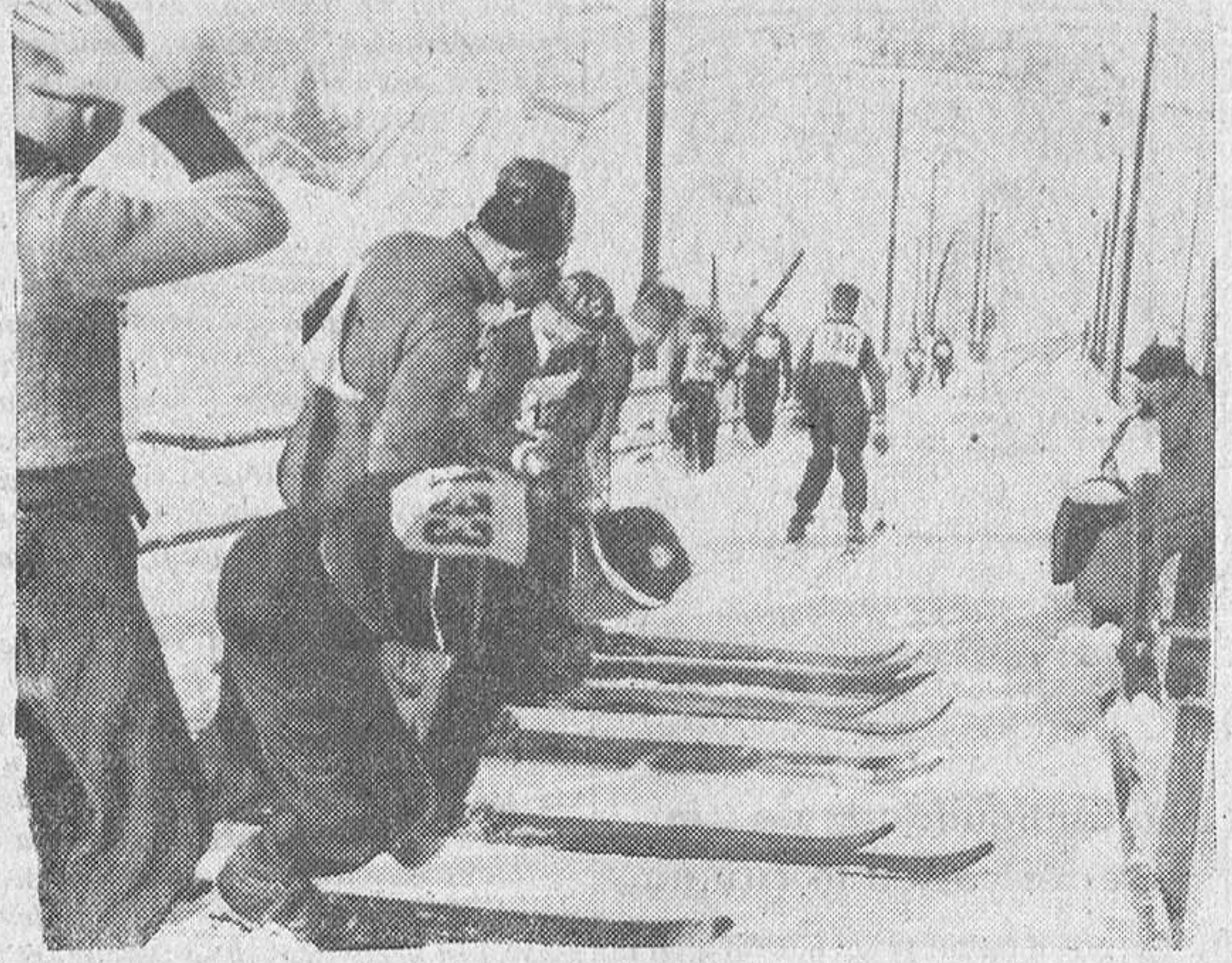
En el magnífico escenario deportivo de Garmisch, la juventud alemana ha celebrado los juegos nacionales de ski. En nuestra foto un grupo de participantes se prepara a lanzarse sobre la pista que termina en el gran trampolín de saltos.