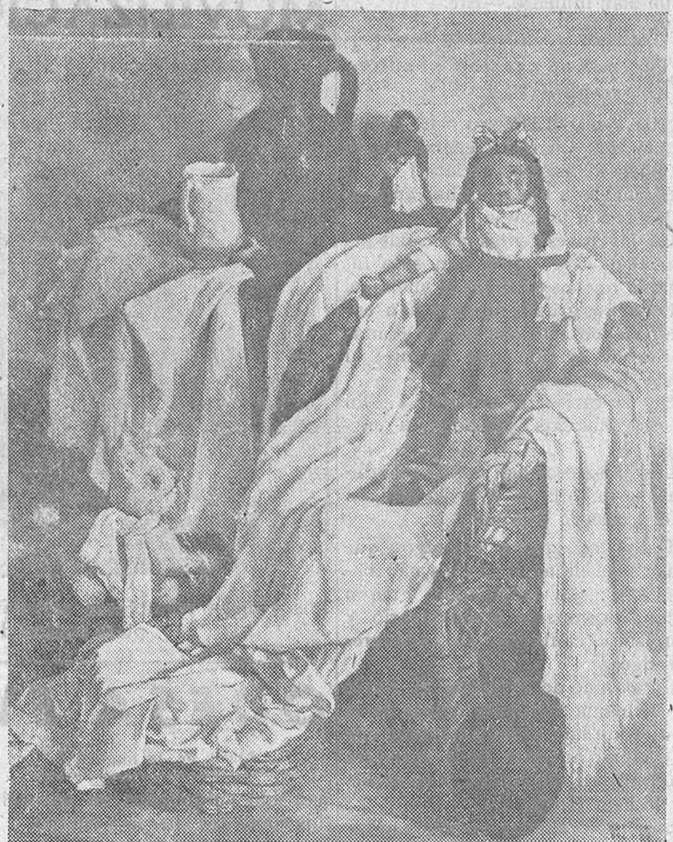
«Rincón de mi casa», bodegón que figuró en la última Exposición Nacional de Bellas Artes, por Abraído del Rey

El éxito logrado por la exposición ha sido así extraordinario y completo, no sólo por el gran número de visitantes que se ha registrado, sino también por el elogio unánime que éstos han tributado a todos los cuadros y por la honda y grata impresión que las obras del valioso artista salmantino Abraído del Rey han producido en cuantos se han detenido a contemplarlas.