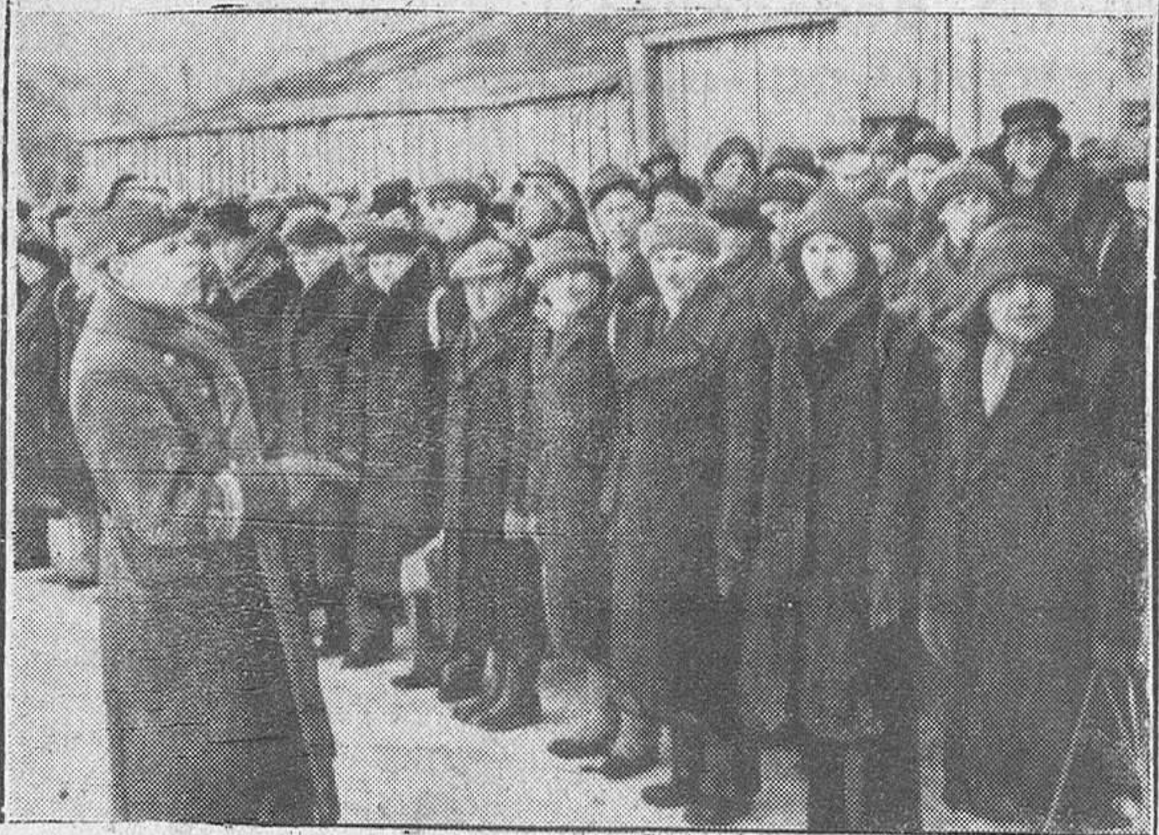
Los últimos reemplazos estonianos incorporados se concentran en la plaza central de la ciudad de Pernau