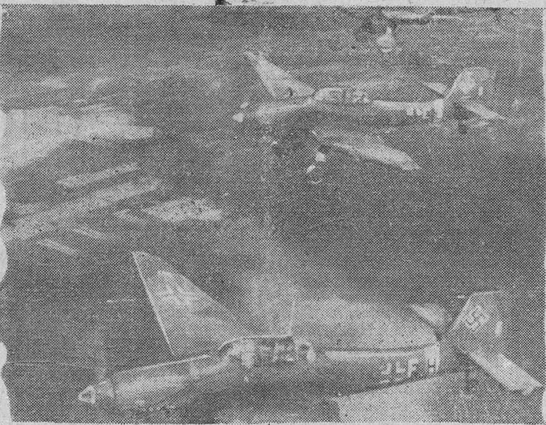
«...no vieron la batalla, ni la aviación alemana».

nico, sobre todo, ha ganado al gobierno y a las autoridades. Los ministros reclaman la prioridad de avanzar con sus grandes automóviles por en medio de esta espantosa escena. El primer ministro señor Pierlot y sus colegas de gobierno señores Spaak, Vanader Poorten y