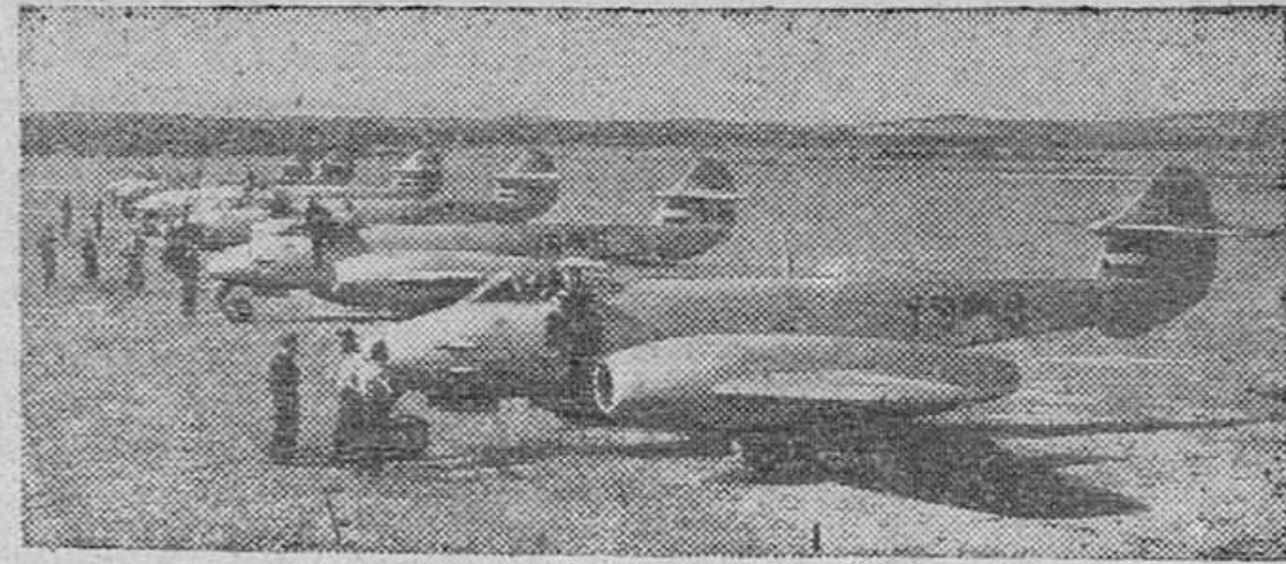
Una escuadrilla de cazas Meteor de la aviación holandesa, que tomó parte en las últimas maniobras realizadas por la R. A. F.