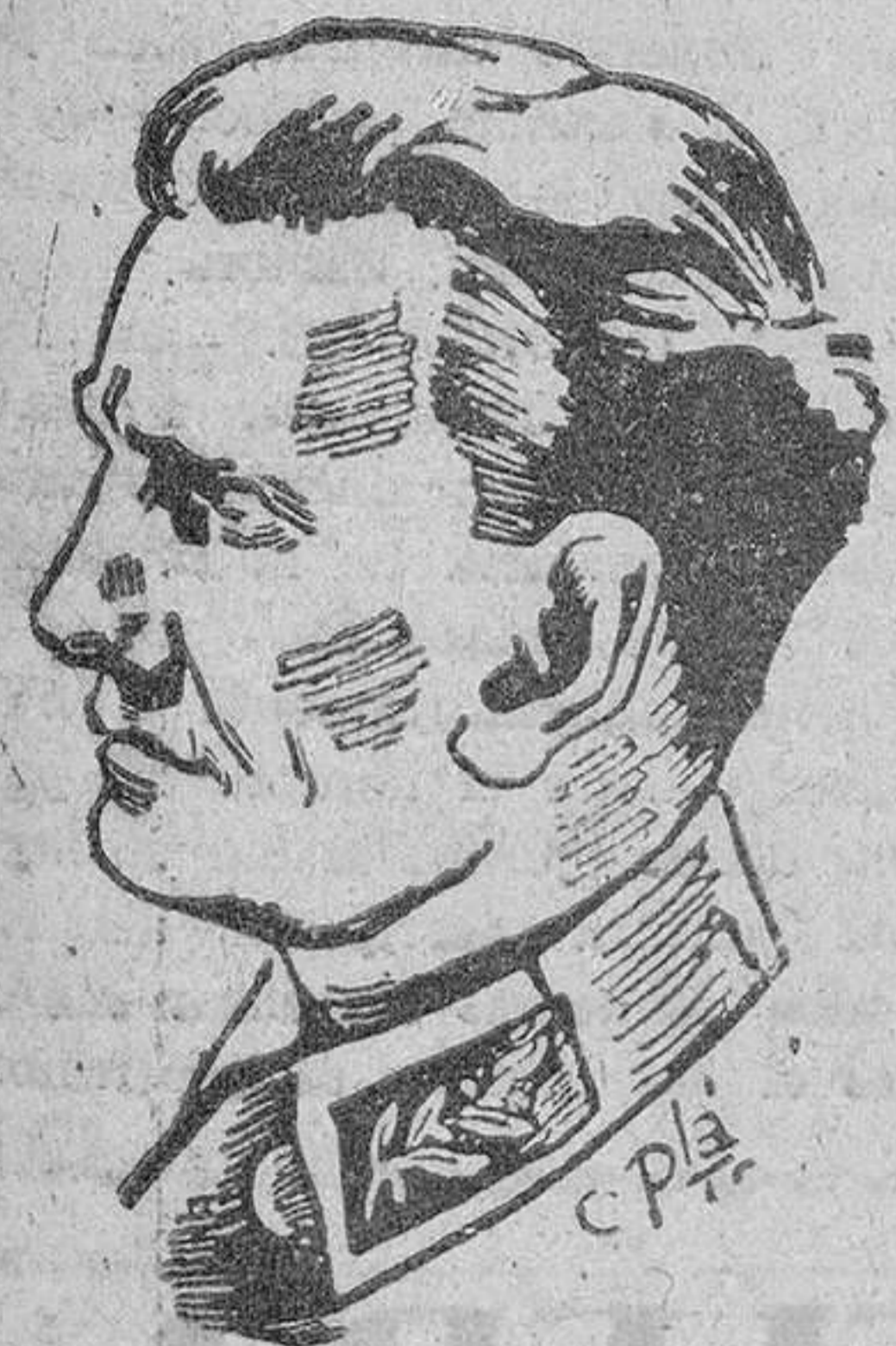
ción de empréstito. Se dice que Dean Acheson es partidario del empréstito.—Efe.

WASHINGTON, 29.—Informan del Banco de Exportación e Importación que se estudia la petición de Yugoslavia de 25 millones de dólares; también el gobierno comunista de esta nación ha solicitado del Banco Nacional norteamericano un empréstito de 50 millones de dólares para dar nuevo impulso a la agricultura. Es la primera vez que este gobierno comunista se dirige al Gobierno de Estados Unidos en peti-