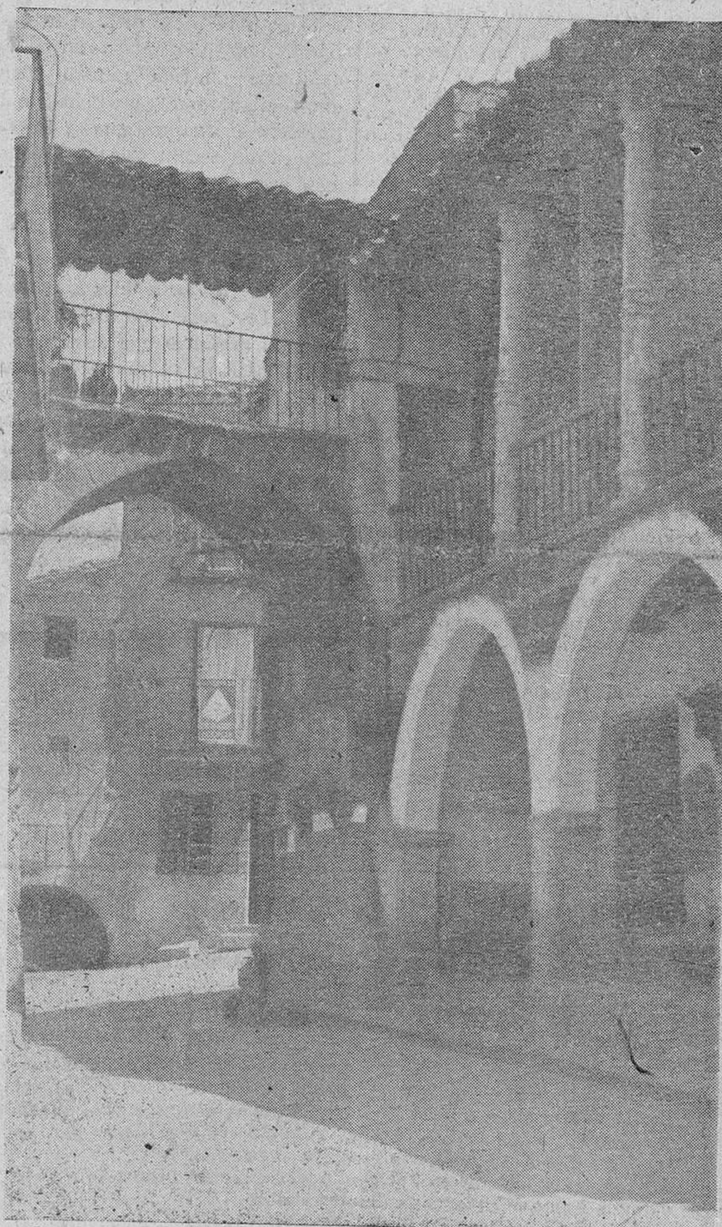
En tercera página publicamos un interesante reportaje sobre el proyecto de abastecimiento de agua a la villa de Fermoselle.—En la foto: Arco que divide la calle de Requejo y que perteneció al Castillo de la villa.