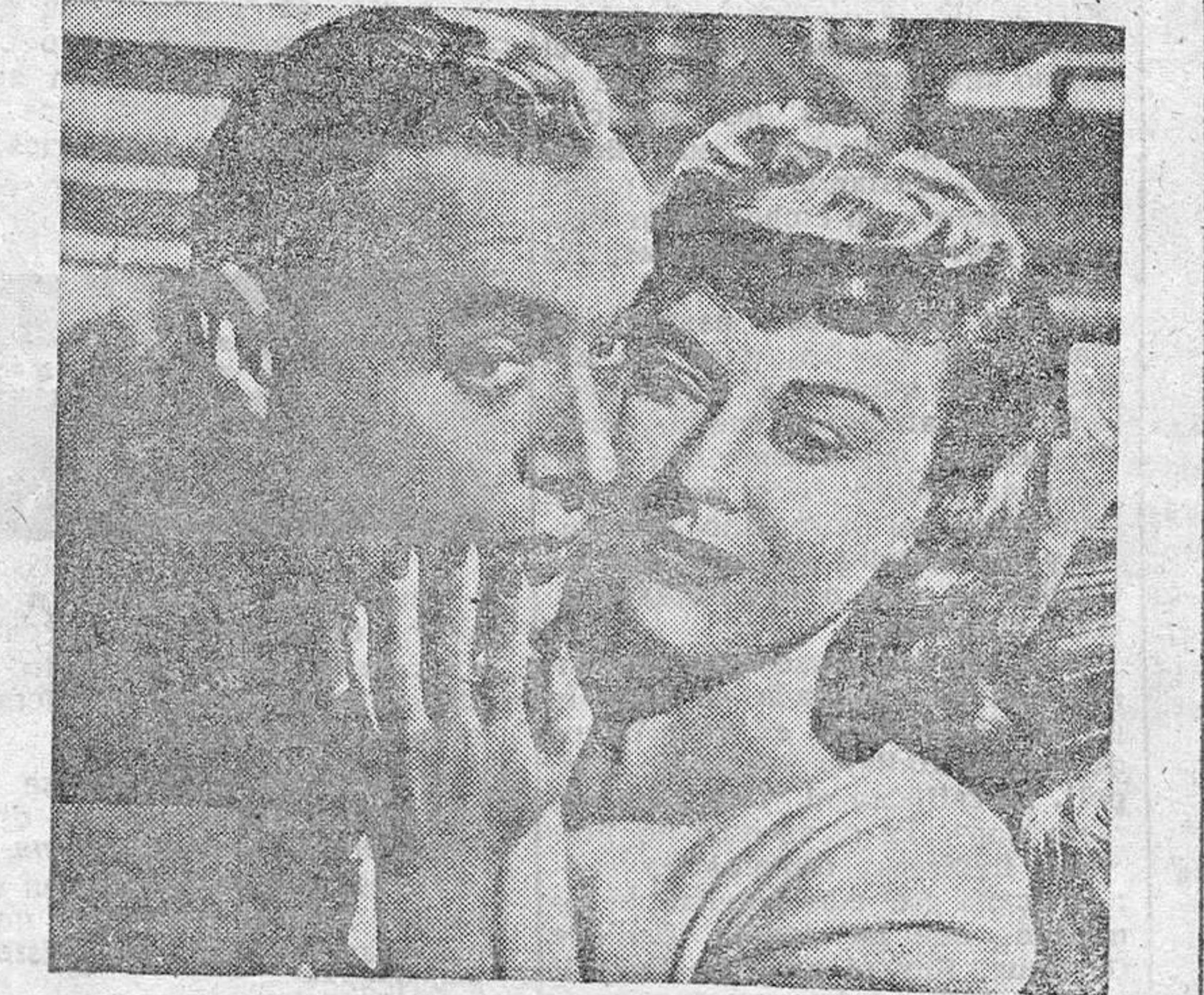
«Si no amaneciera», otra película que llenó las salas.

Siguen notas de Ayuntamientos y Parte No Oficial.