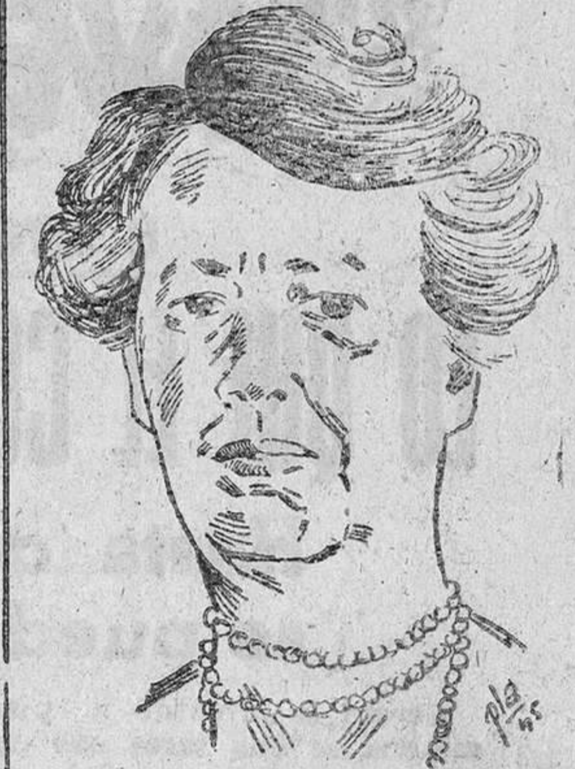
LA SEÑORA ROOSEVELT

arzobispo de Nueva York le dice que su labor anticatólica está sobradamente de manifiesto ante todos los ojos, en documentos discriminatorios contra el catolicismo, indignos de una madre americana. Esa labor se concentra en los artículos cotidianos de la vi-