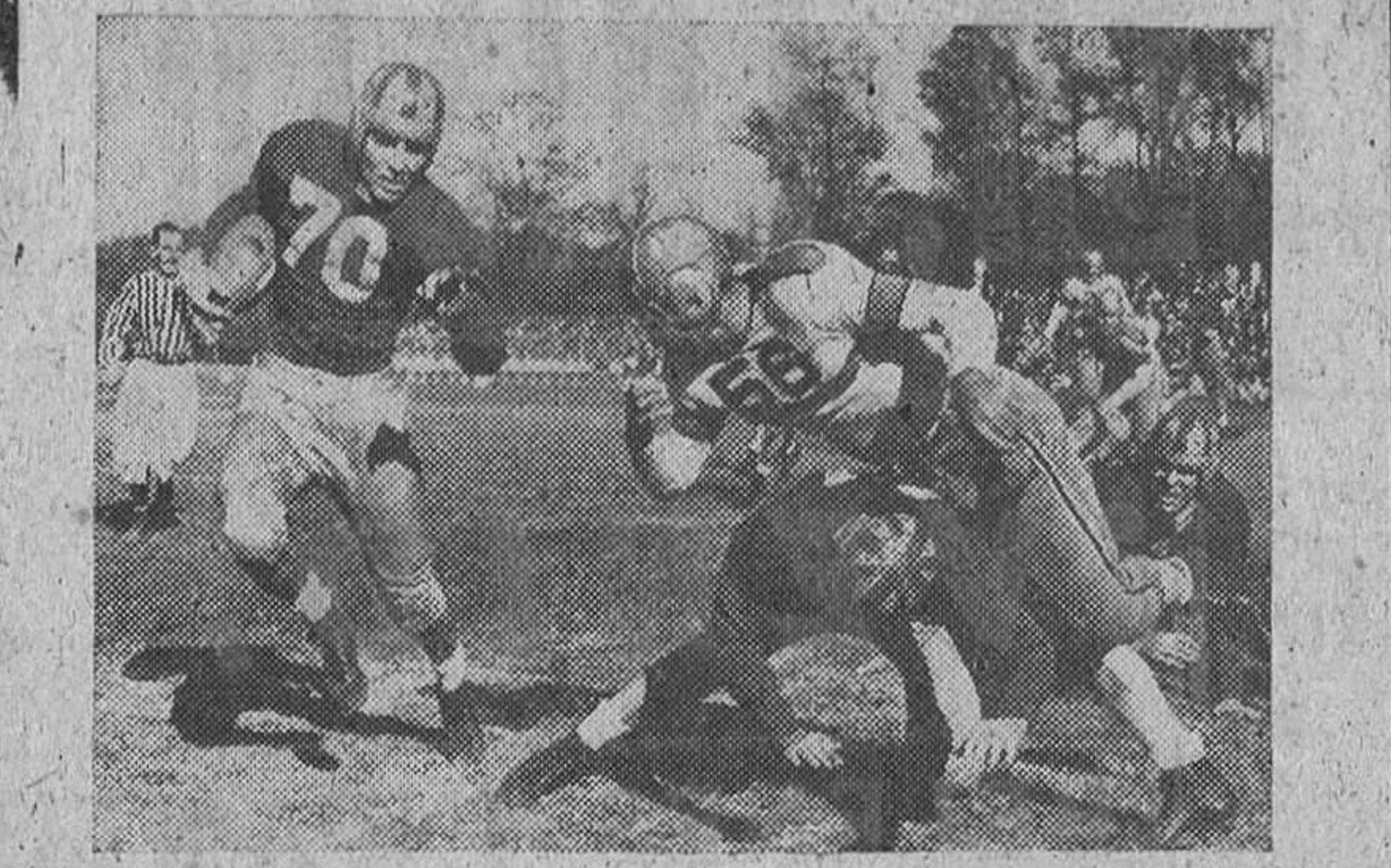
En un partido de «football» norteamericano, cada jugador tiene una misión específica. Obsérvese cómo uno bloquea al adversario para permitir que su compañero siga corriendo con el balón ovalado en su poder.

¡Imaginad, la sorpresa del norteamericano! Viene a España y se encuentra con que el equipo que él conoce con el nombre de "football" se llama aquí "rugby", que sabe que es un deporte muy distinto, que se juega más en Inglaterra que en los Estados Unidos.