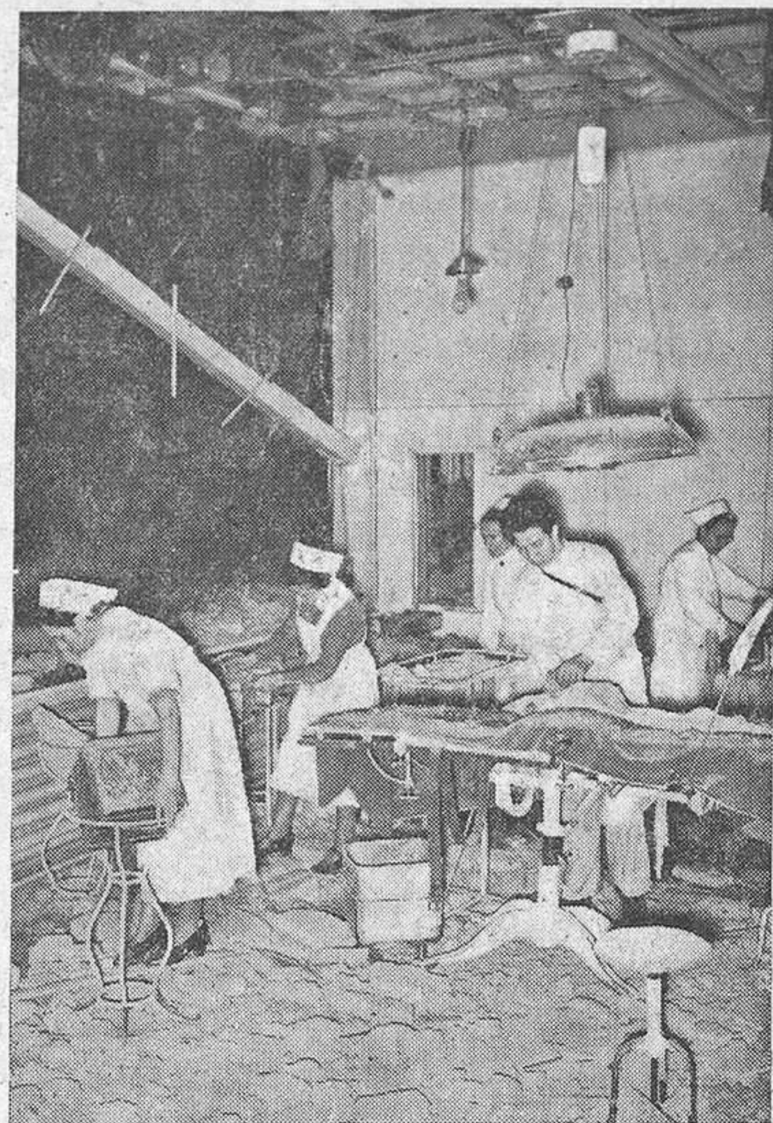
La foto muestra los destrozos causados en una de las salas de operaciones

La aviación inglesa bombardeó durante una incursión nocturna el Hospital «Robert Kech» de Berlín, universalmente conocido por sus grandes servicios prestados a la Ciencia, investigación médica y sobre todo a la humanidad doliente. Muchos enfermos fueron muertos o heridos gravemente.