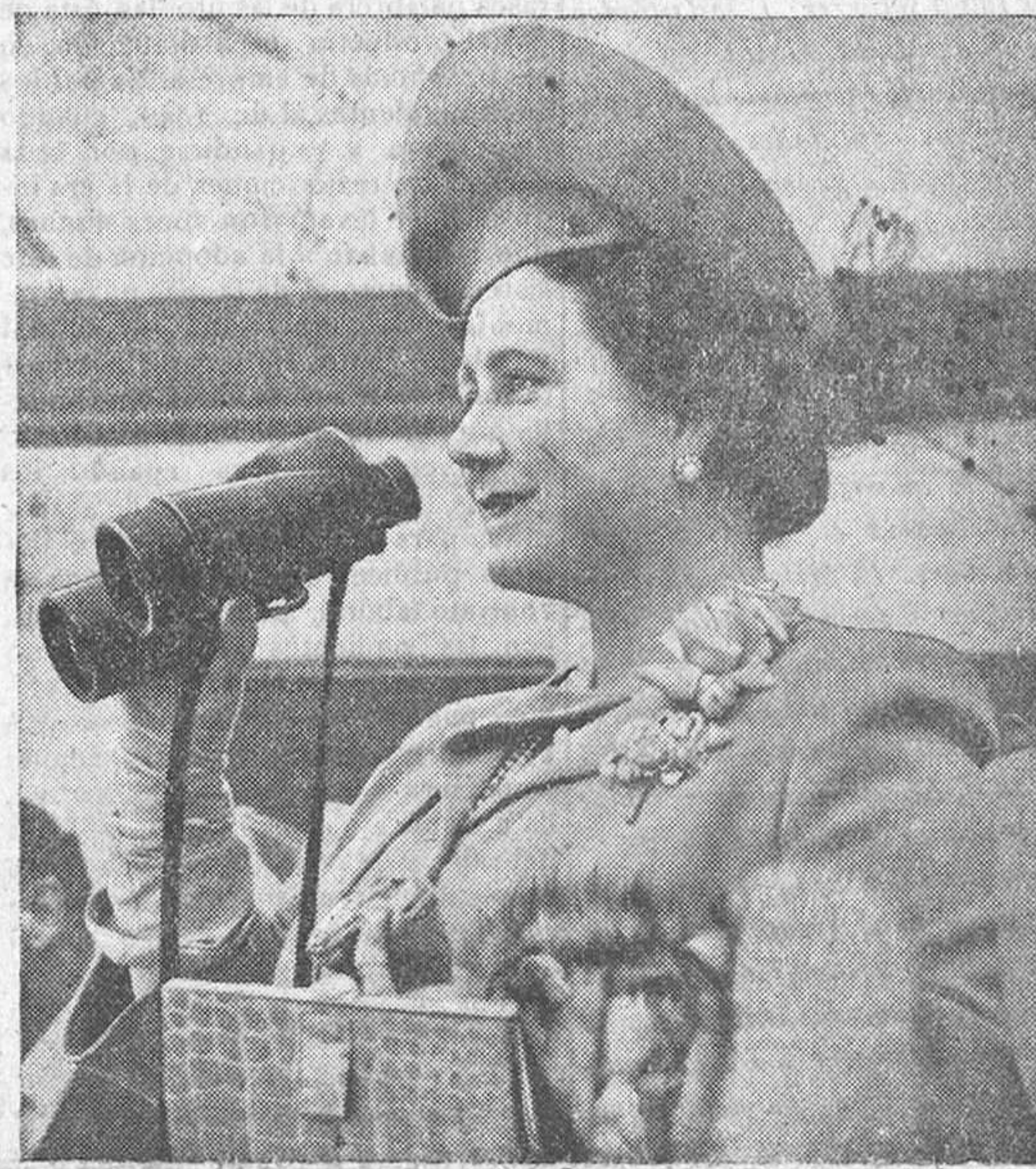
La reina de Inglaterra fotografiada en el puente del «Queen Elizabeth», durante el viaje de pruebas del gran trasatlántico.