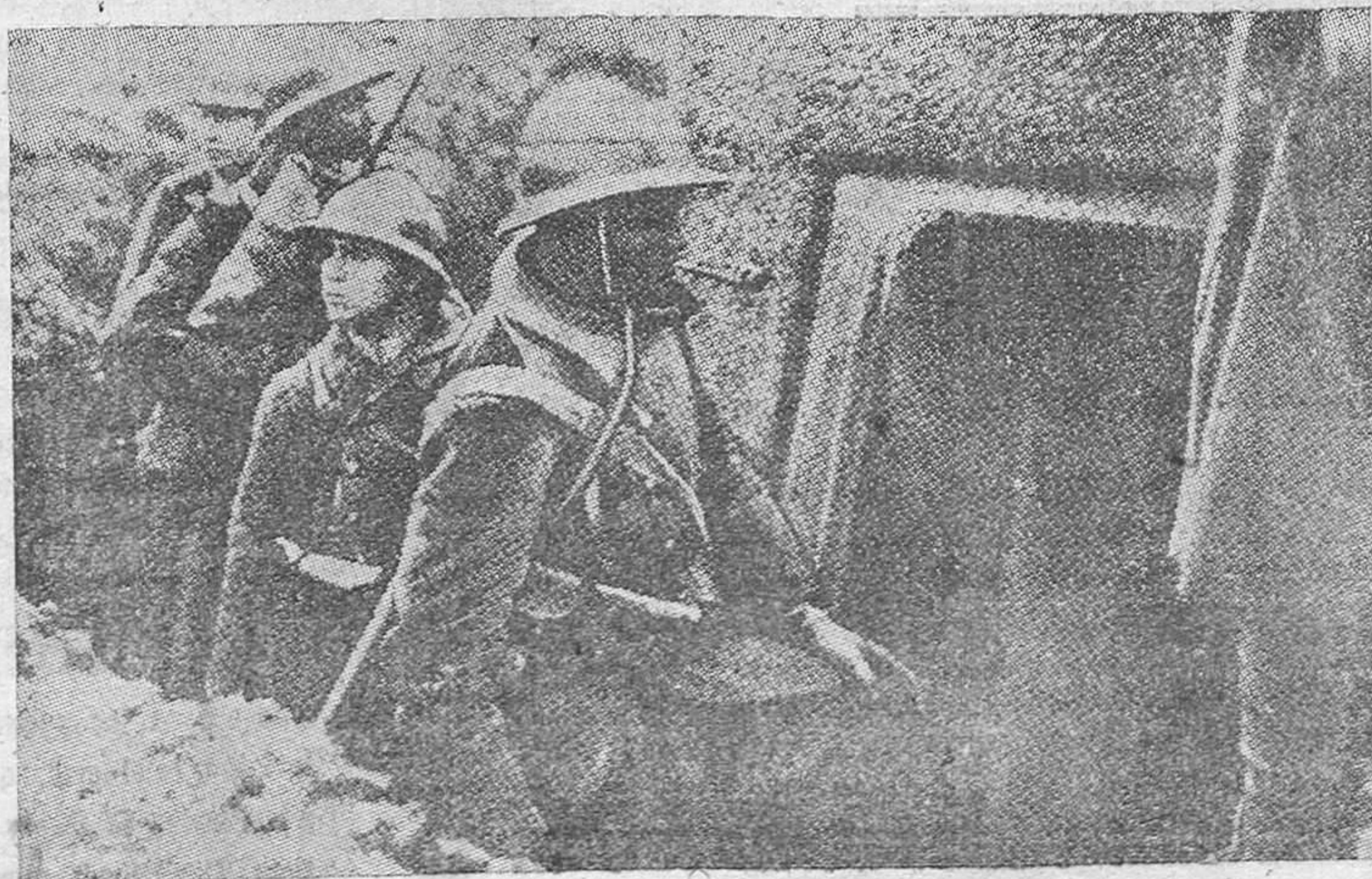
Un grupo de tiradores senegaleses penetra en un refugio de la línea Maginot