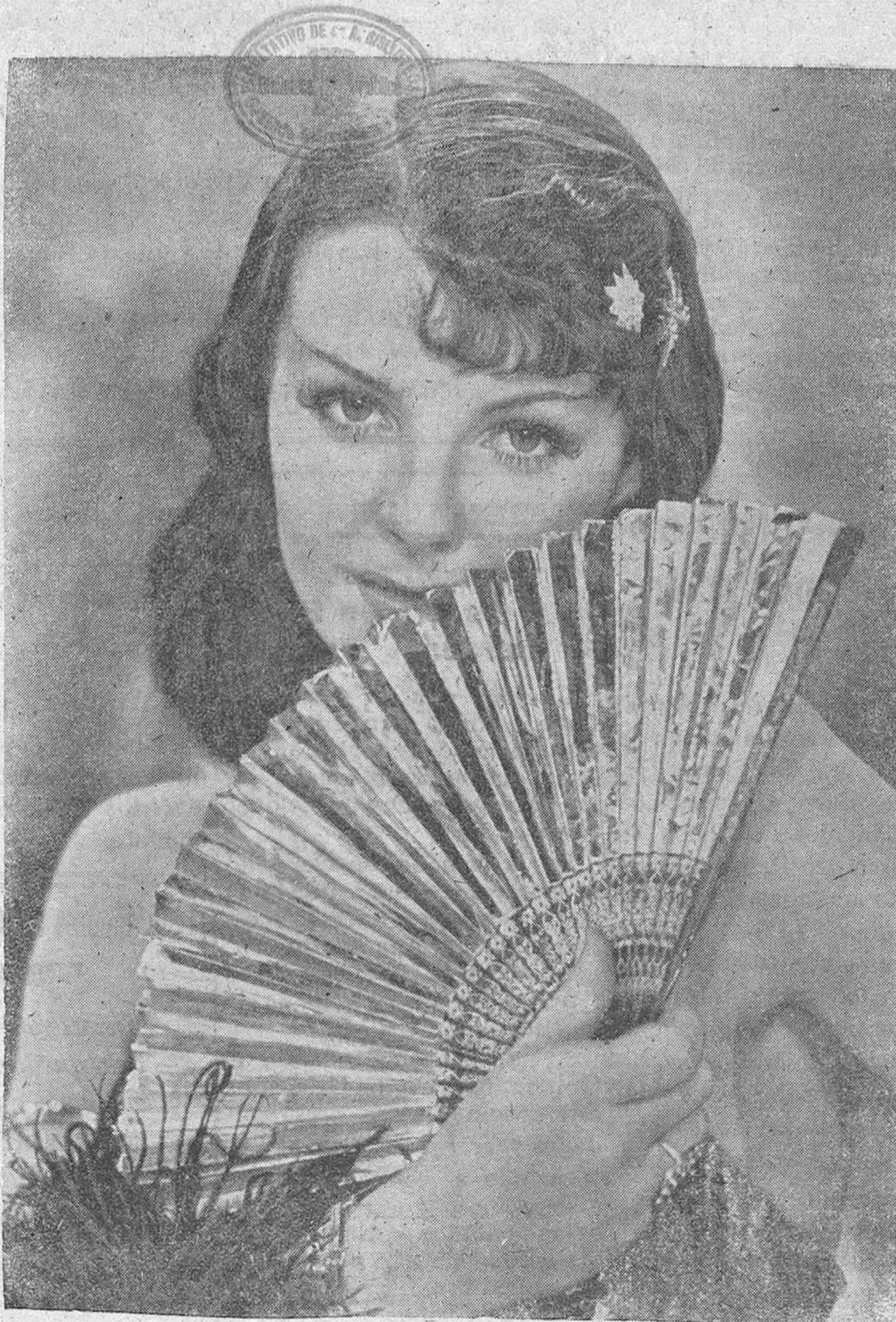
HILDE KRAHL, artista alemana, en un primer plano de su última producción

rián Rey, bajo el nombre prestigioso y garante de Cifesa, lleva al acervo del cine nacional, un asunto como el de «La Dolores» que, haciéndonos vibrar y poner en tensión todos los sentidos del alma española, conseguirá que éste recorra el