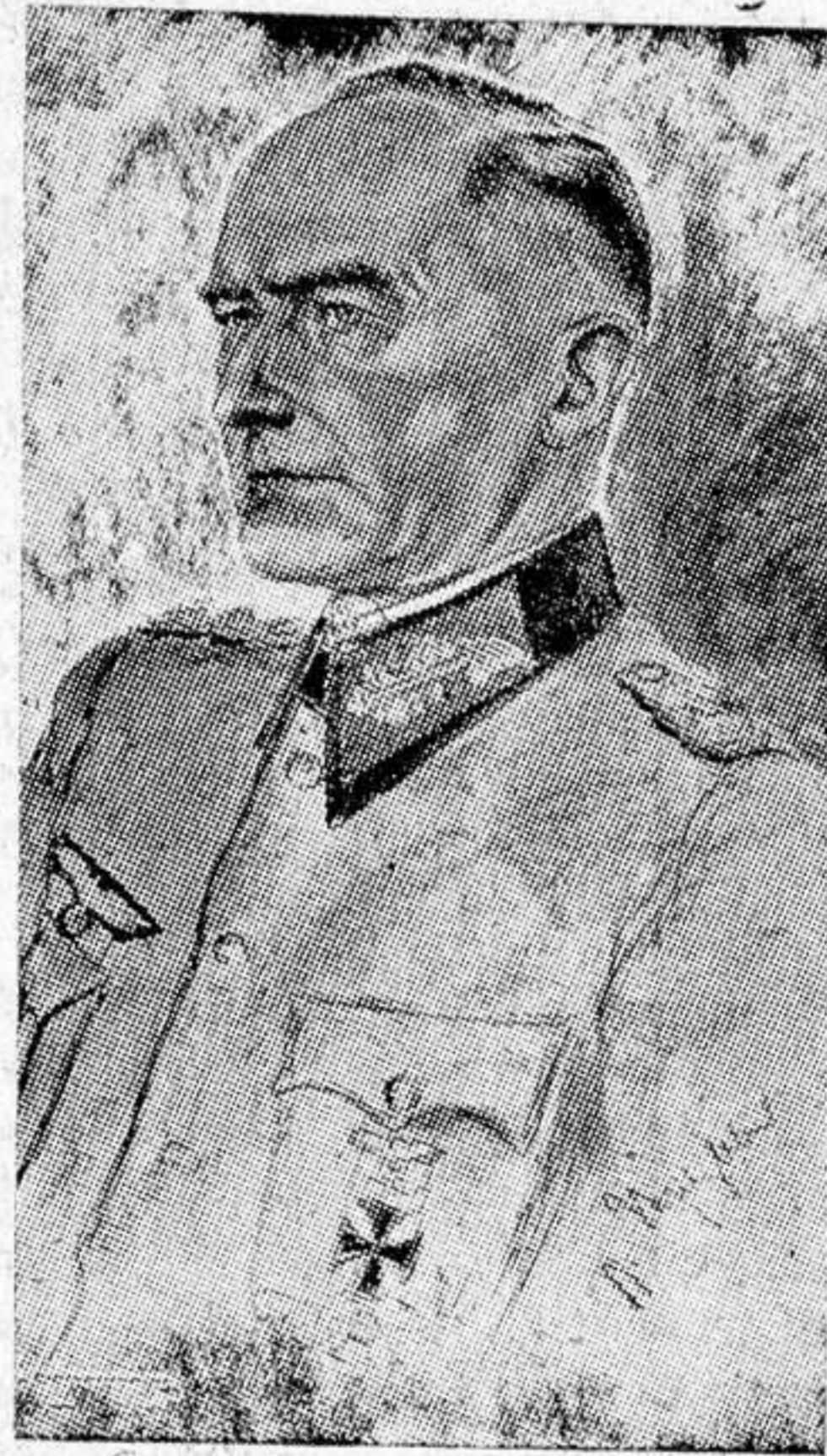
General Witzleben, ascendido a Mariscal de Campo

El resultado total de la guerra comercial contra la Gran Bretaña desde el comienzo de las hosti-