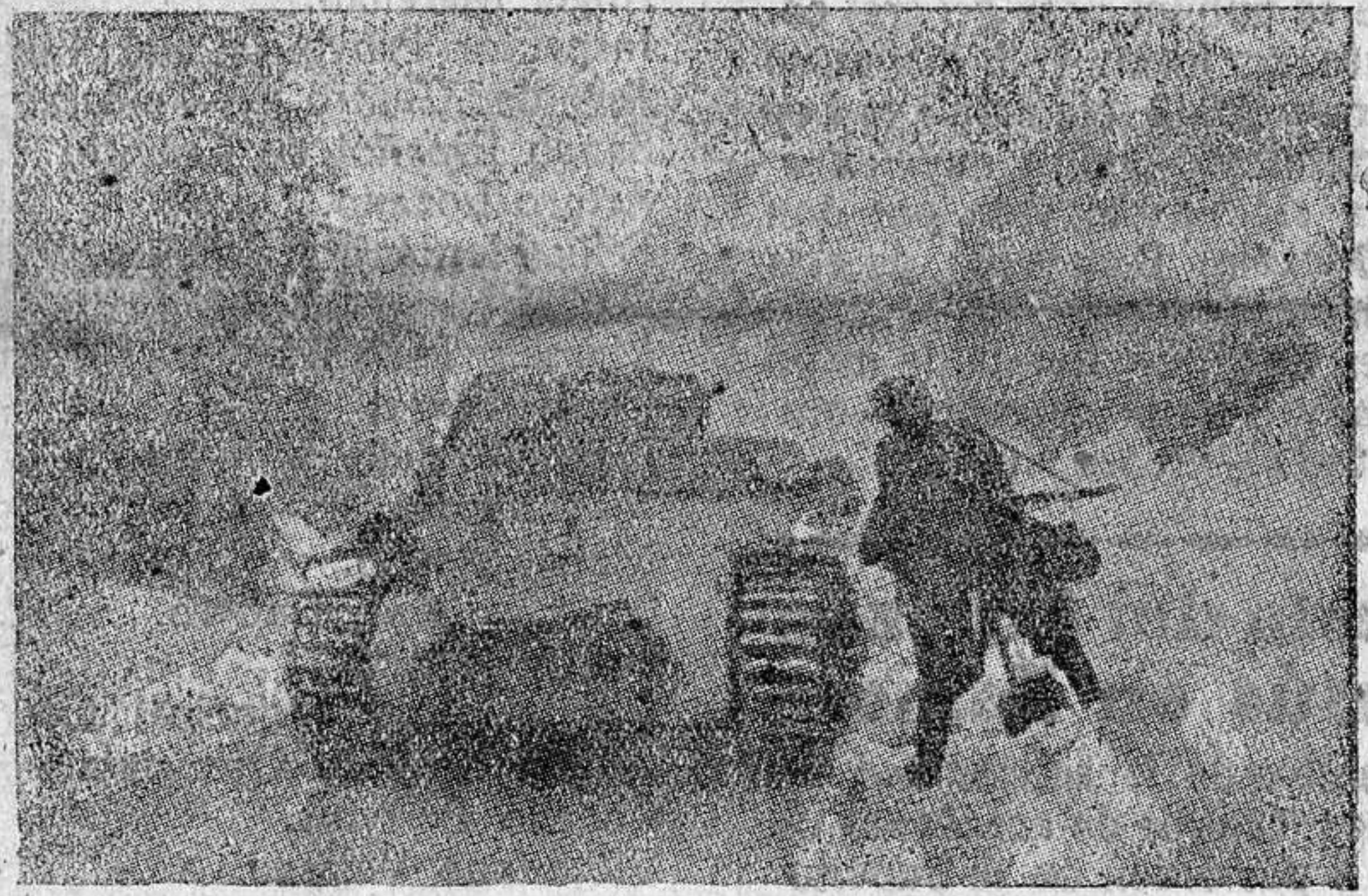
Tanque alemán en las avanzadillas del Norte de Noruega

De repente, resonó un gran estuendo y se elevó una gran llamarada. Después una nube de humo. Esto fué todo. El destructor había sido partido en dos pedazos, que aún flotaban sobre el agua; pero que pronto desaparecieron.—EFE.