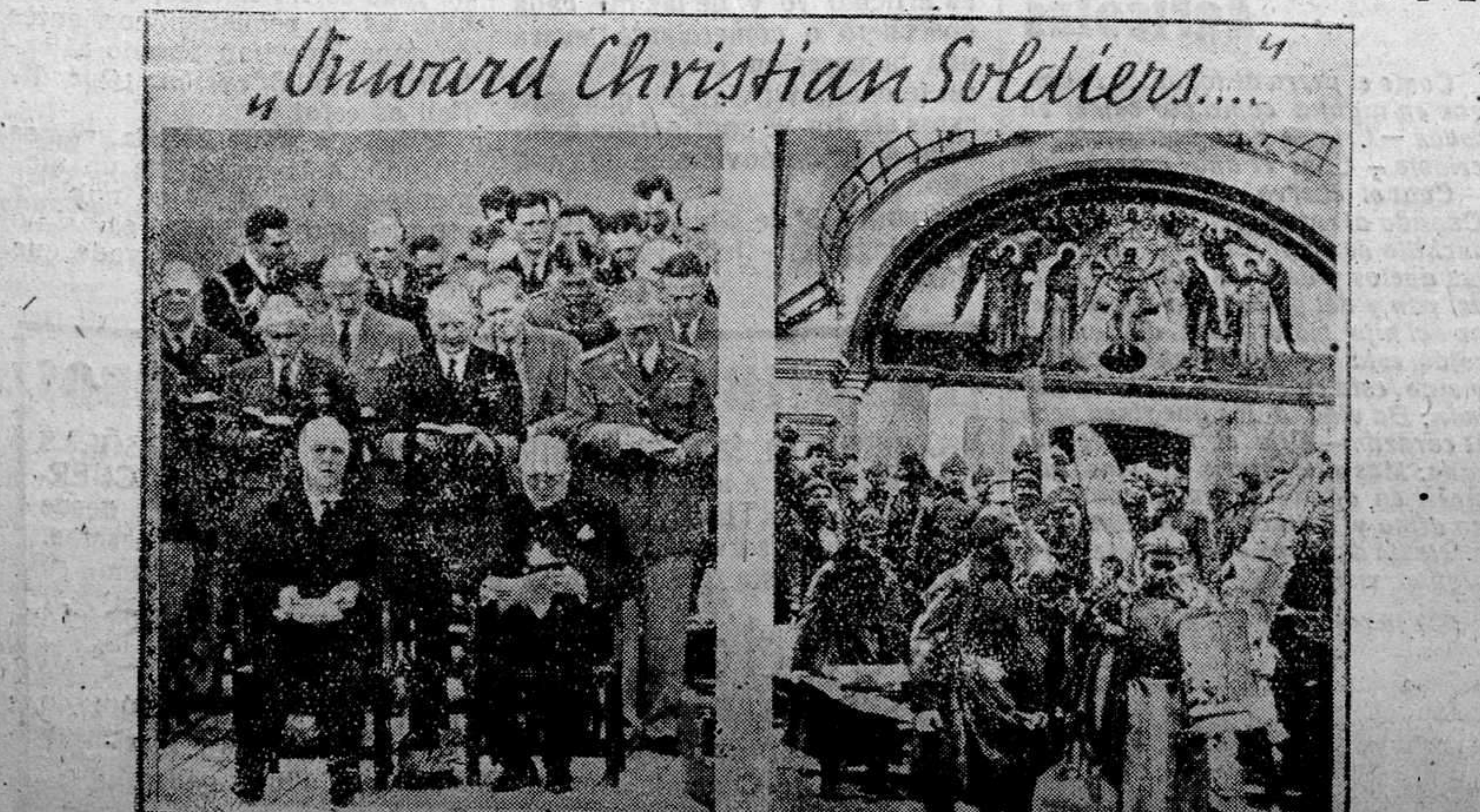
En la entrevista del «Potomac», Churchill y Roosevelt cantaron el himno protestante «Adelante soldados cristianos». Seguramente se referían a los bolcheviques que en la foto de la derecha saquean un antiguo convento ruso