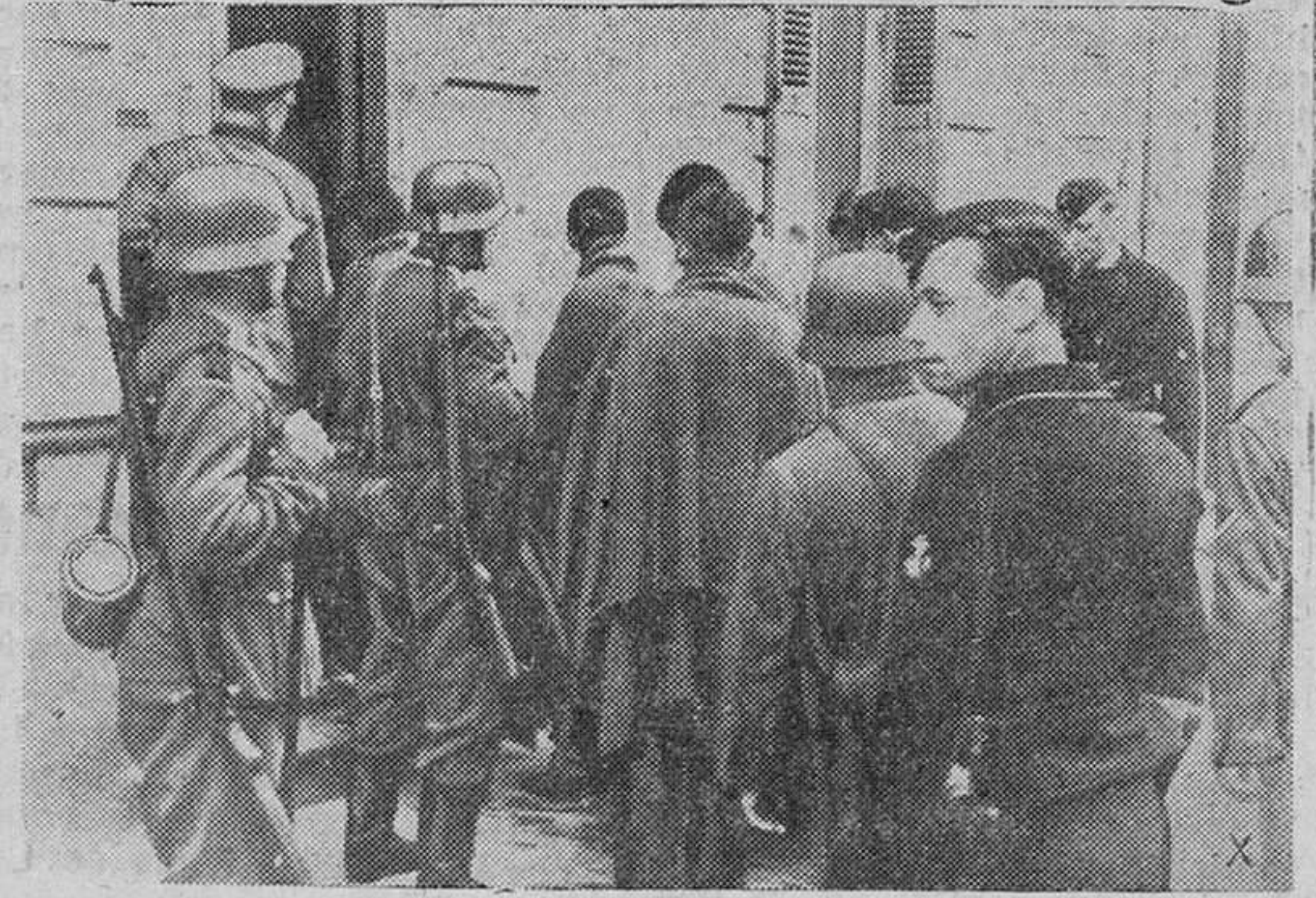
Prisioneros ingleses en el pequeño puerto francés St. Nazaire, después del fracasado golpe de mano ordenado por Churchill

Los periódicos neoparaguinos, al comentar la noticia, se preguntan si este hecho no constituirá el comienzo de una contraofensiva aliada en el frente de Sittang, e indican que las tropas anglo-chinas, apoyadas por la aviación británica y los voluntarios norteamericanos, se encuentran preparados para redoblar su resistencia en los puntos estratégicos de importancia esencial. El Alto Mando aliado no oculta la gravedad de la situación, pues los japoneses reaccionan considerablemente estupefactos por la conquista de Mandalay en un breve plazo. Se hace notar que el norte de Birmania es el último punto de unión de China y la India.—Efe.