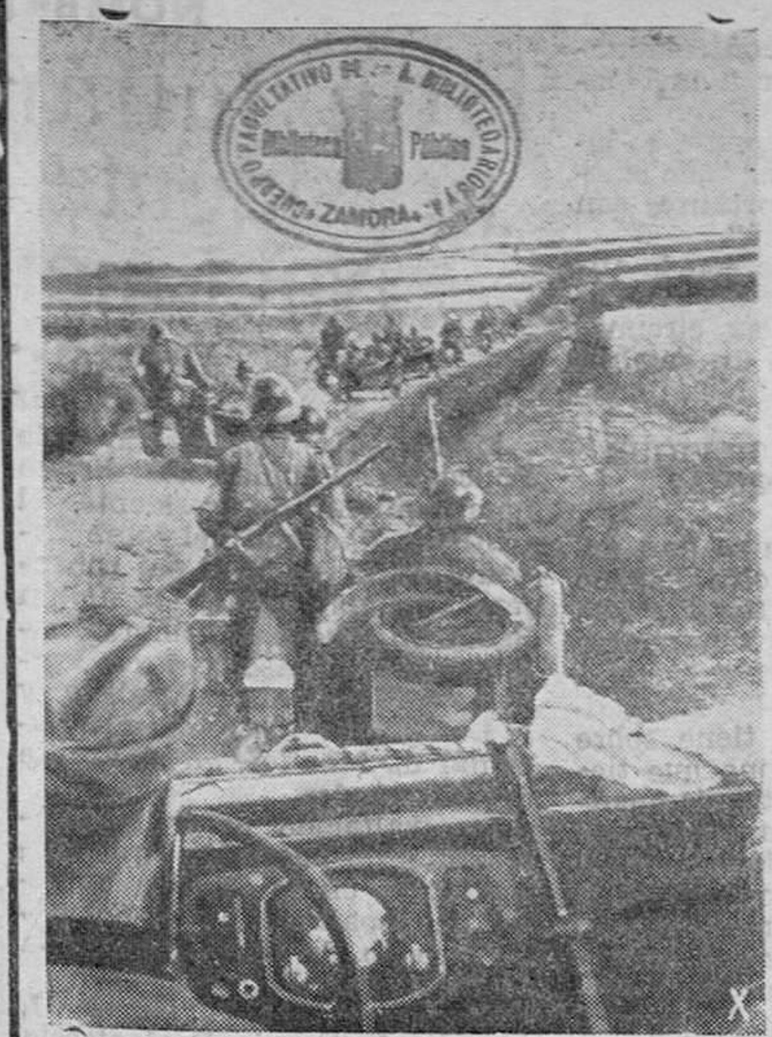
En el frente del mar Negro, combaten los soldados alemanes y rumanos contra el bolchevismo con toda fraternidad.

Bucarest.—De regreso de su viaje de inspección por la Besarabia, la Bucovina, Transilvania y Crimea, el mariscal Antonescu ha expuesto ante el Consejo de ministros la situación del ejército y el estado de las obras de reconstrucción en las regiones recobradas por Rumania. Refiriéndose en primer término a las fuerzas armadas, declaró que había tenido ocasión de comprobar que el soldado rumano iguala a los mejores del mundo cuando está, como ahora, bien armado, instruido y mandado. En cuanto a la situación económica, el Conducator indicó los resultados de la campaña agrícola emprendida en las provincias liberadas y afirmó que la producción obtenida asegurará las necesidades de la población rural y urbana. Añadió que los hospitales están bien atendidos y abastecidos, tanto los militares como los civiles. La obra de reconstrucción más importante se ha llevado a cabo en el terreno de las comunicaciones. Según anunció el mariscal, el tráfico ferroviario ha sido restablecido por completo, y sólo en Besarabia se han reconstruido o reparado más de mil quinientos puentes y carreteras, con sus correspondientes tendidos de hilos telefónicos y telegráficos, mediante la cooperación de todos los sectores de la producción. Antonescu terminó invitando a los ministros a visitar con frecuencia las regiones apartadas del país y elogiando el esfuerzo desplegado por los rumanos durante el pasado año.—Efe.