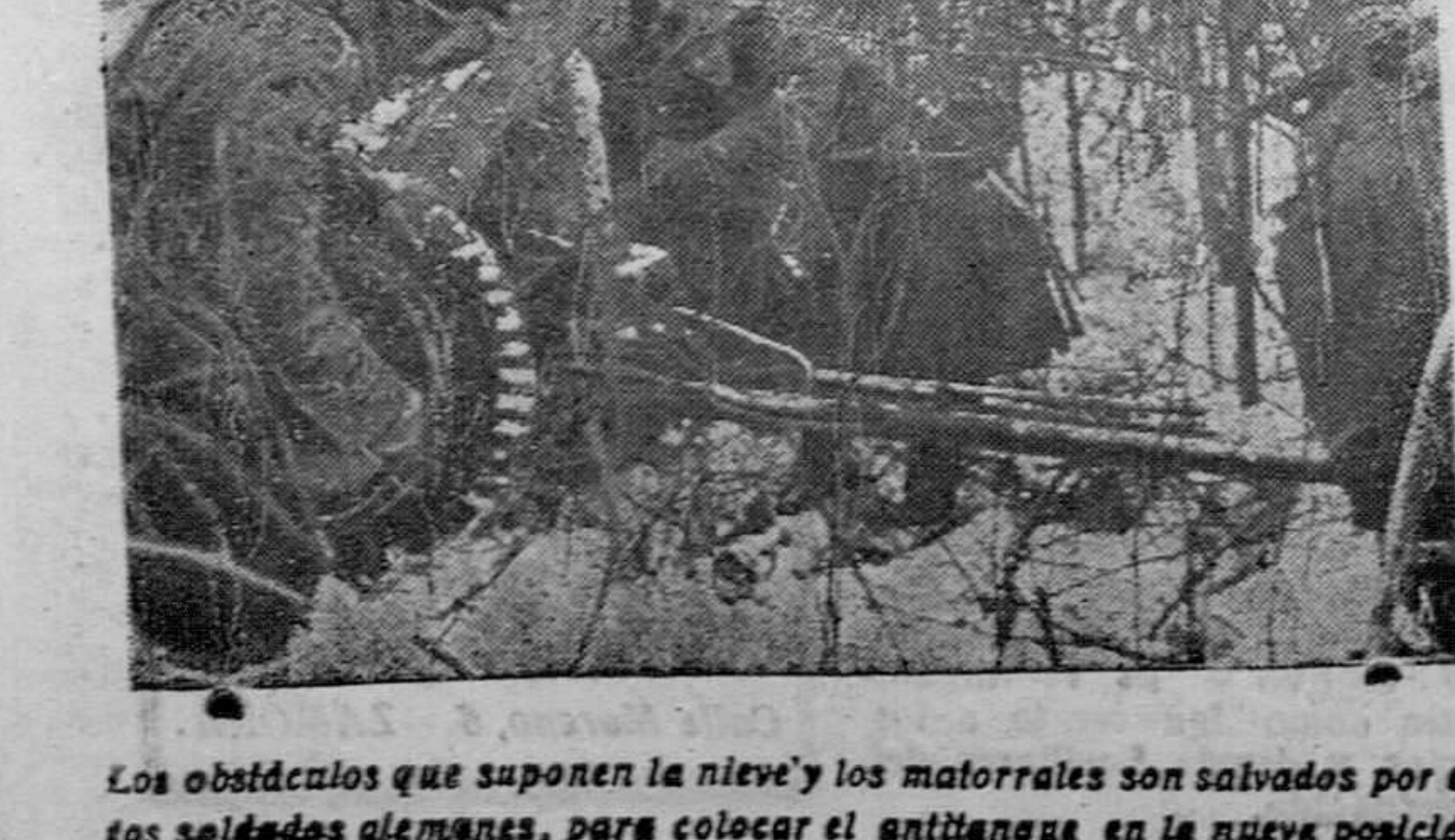
Los obstáculos que suponen la nieve y los matorrales son salvados por los soldados alemanes, para colocar el antiaéreo en la nueva posición.

La ampliación de la Biblioteca, ha ido unida íntimamente al crecimiento de Prusia y del Imperio alemán: En el 1800 se compró hasta cerca de tres millones en la actualidad. Solo sus tres catálogos, son lo suficiente para formar una gran biblioteca que llenaría de orgullo a una ciudad: el de orden alfabético, que se compone de 3.500 folios, el de materias, con 1.800 volúmenes, estos para uso del público y el grandísimo por orden alfabético de papeletas, para el orden interior de la Bi-