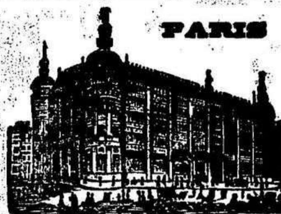
GRANDES ALMACENES DEL

Las pólizas de esta Compañia pueden rescindirse al fin de cada año. El infrascrito, habiendo sido nombrado gerente de la Compañia por Gi- braltar y su campo, dará los informes que se deseen para efectuar seguros sobre incendios, explosión de gas y rayos, como tambien para seguros sobre la vida.— JUAN GARESE.—GIBRALTAR.