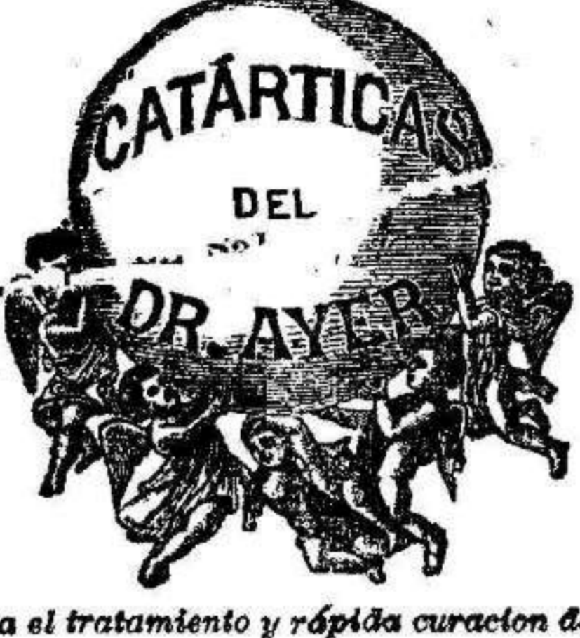
Para el tratamiento y rápida curacion de las

Enfermedades del estómago y de los intestinos, padecimientos del Hígado, dispepsia, indigestiones, cólicos, náuseas, diarrea, presión de vientre, falta de apetito, incomodidad despues de la comida, jaquecas y dolores de cabeza crónicos, reumatismos y nevralgias, enfermedades de la piel, molestias periódicas de las señoras, y ademas de estas, muchas otras enfermedades que se clasifican bajo una infinidad de nombres, pero que todas provienen de la misma causa, á saber: Desarreglos de los Organos de la Digestion y Asimilacion , cuyos desórdenes son la causa de la impureza y pobreza de la sangre, comunicando, de este modo, debilidad y congestion á todos los organos vitales del sistema. Se vende en Murcia en la Farmacia Catalana al lado de la Droguería de Ferrer hermanos, Plaza de S. Julián.