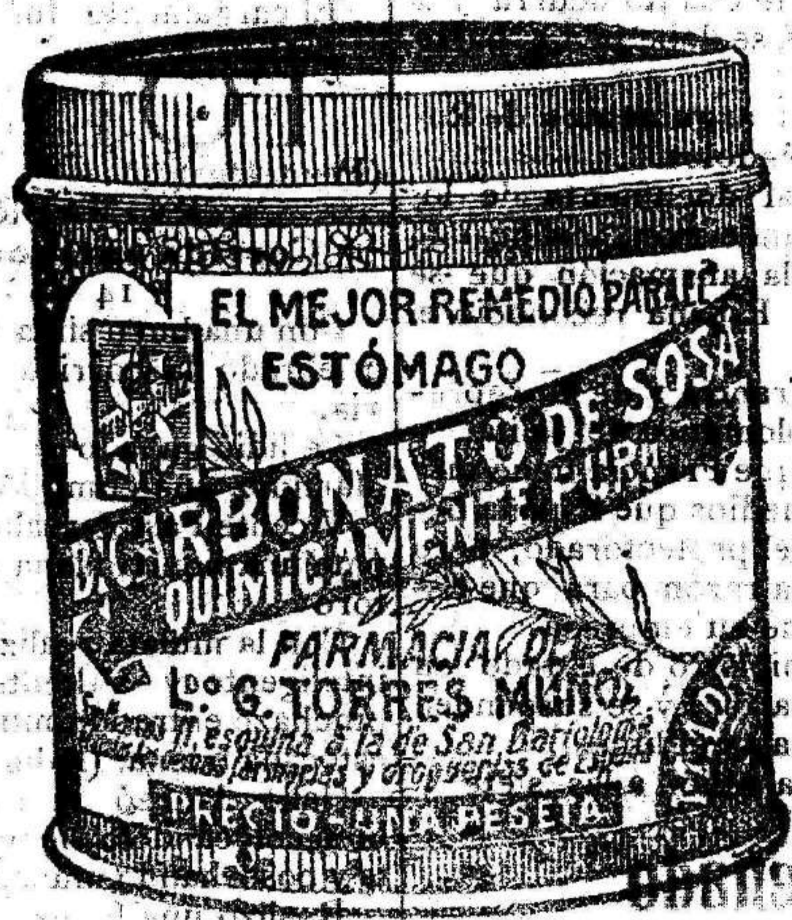
Cuidado con las imitaciones que son perjudiciales