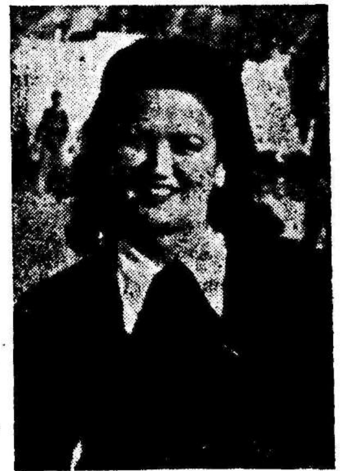
Guardameta del equipo de balón-mano de la Sección Femenina de Murcia, que con su formidable actuación clasificó a éste para la final del Campeonato de España.