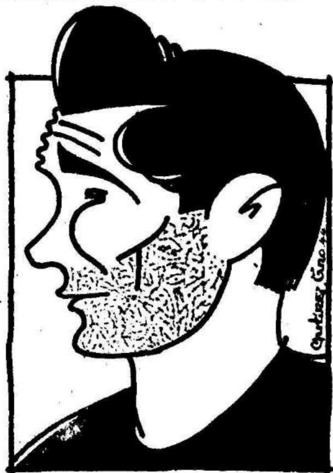
Carpena, que ayer se reveló como un formidable extremo derecha

NO LO DUDE La BICICLETA más PERFECTA «ALBURQUERQUE»