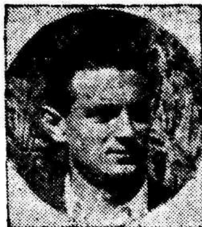
Morera, que volvió a ser el cerebro de la delantera

A medida que pasan los minutos, se acentúa el dominio murciano, cuyos medios se multiplican en verda-