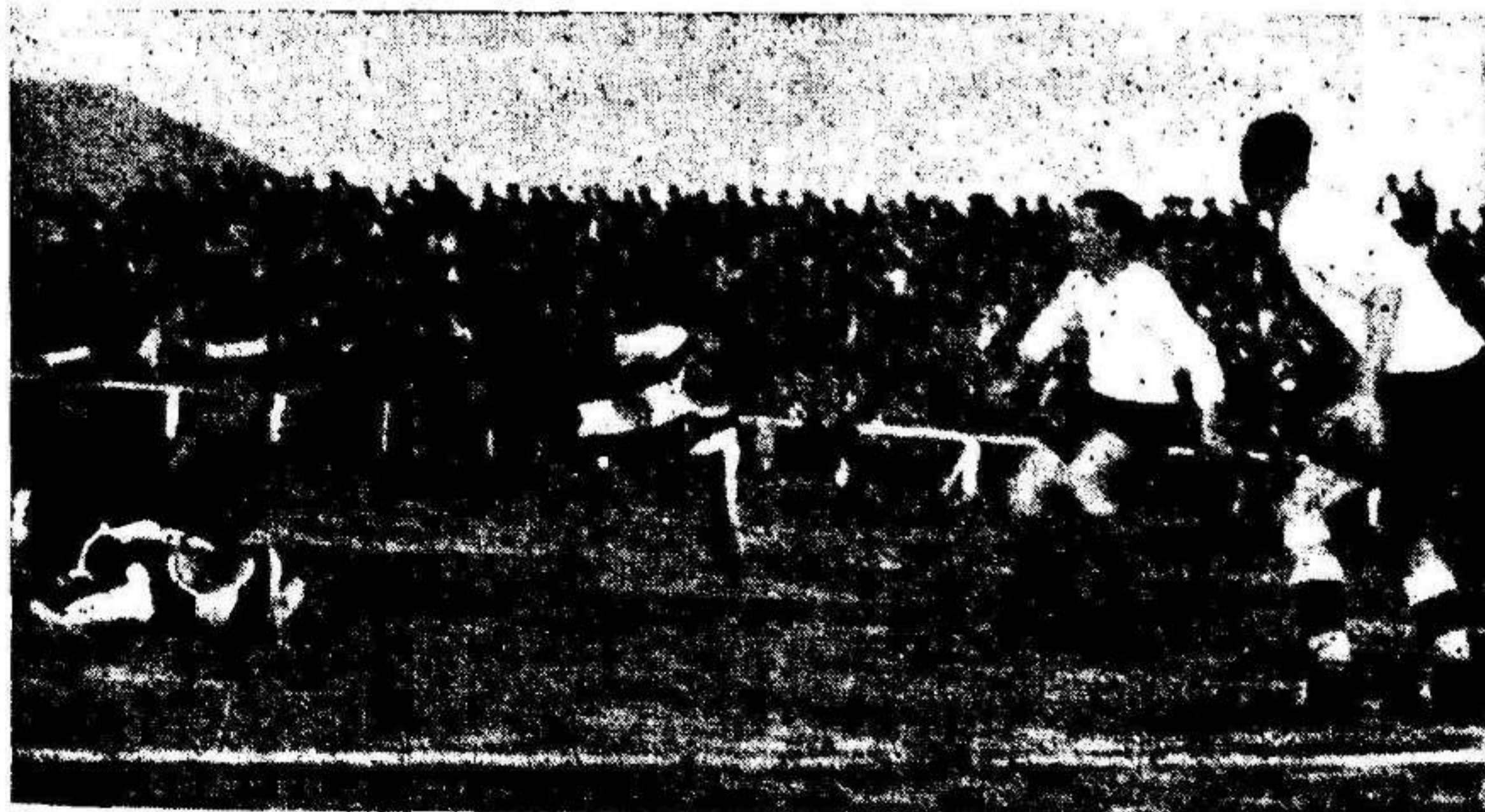
Unas acrobacias de los delanteros alicantinos ante el marco cartagenero.