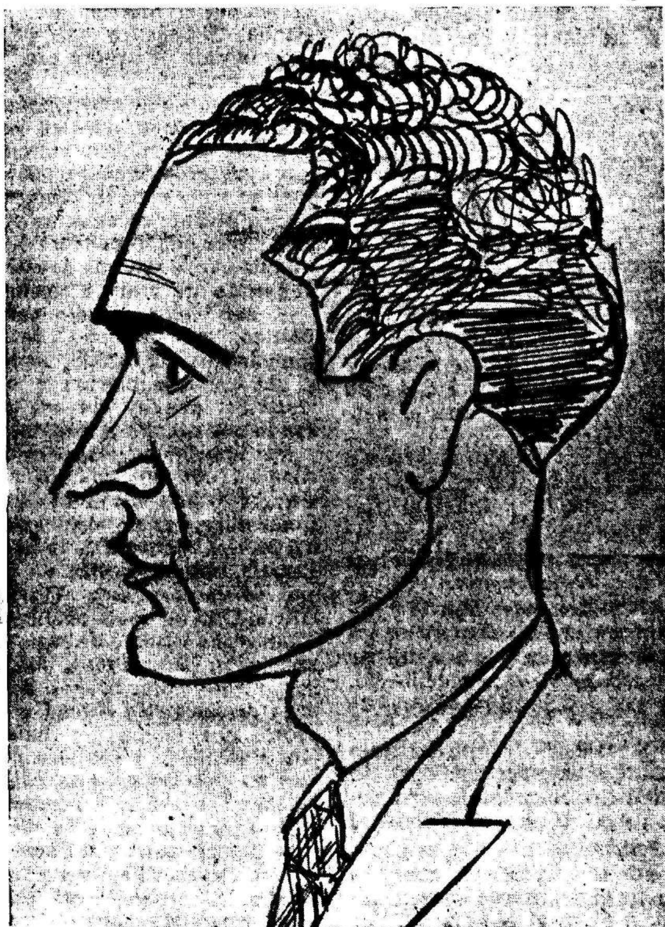
El veterano defensa, actualmente en plena forma, y la figura que más ha destacado en el equipo murciano, en el presente campeonato regional.