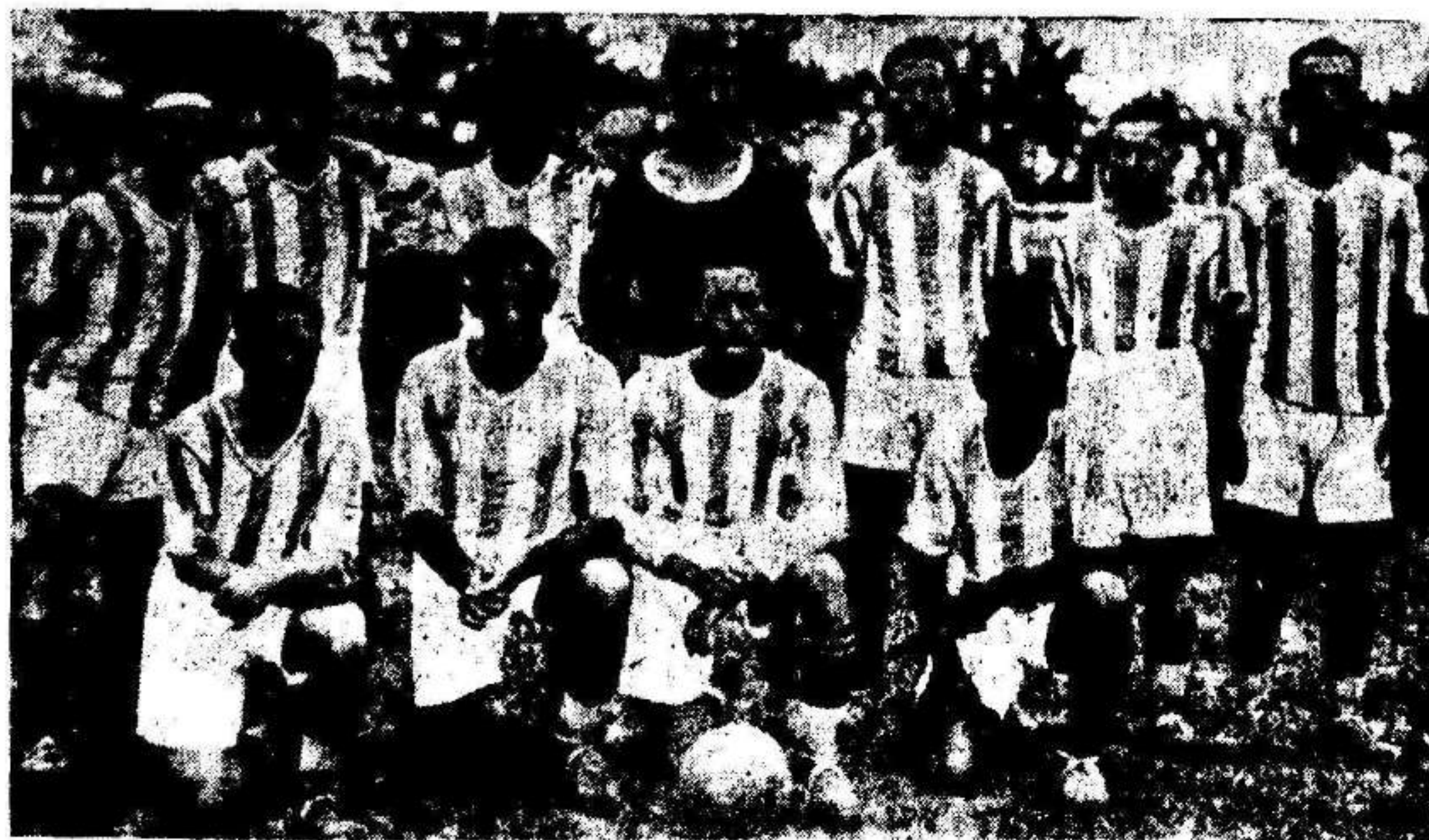
Equipo de la Gimnástica-Abad, de Cartagena, que fué vencido por el Murcia.