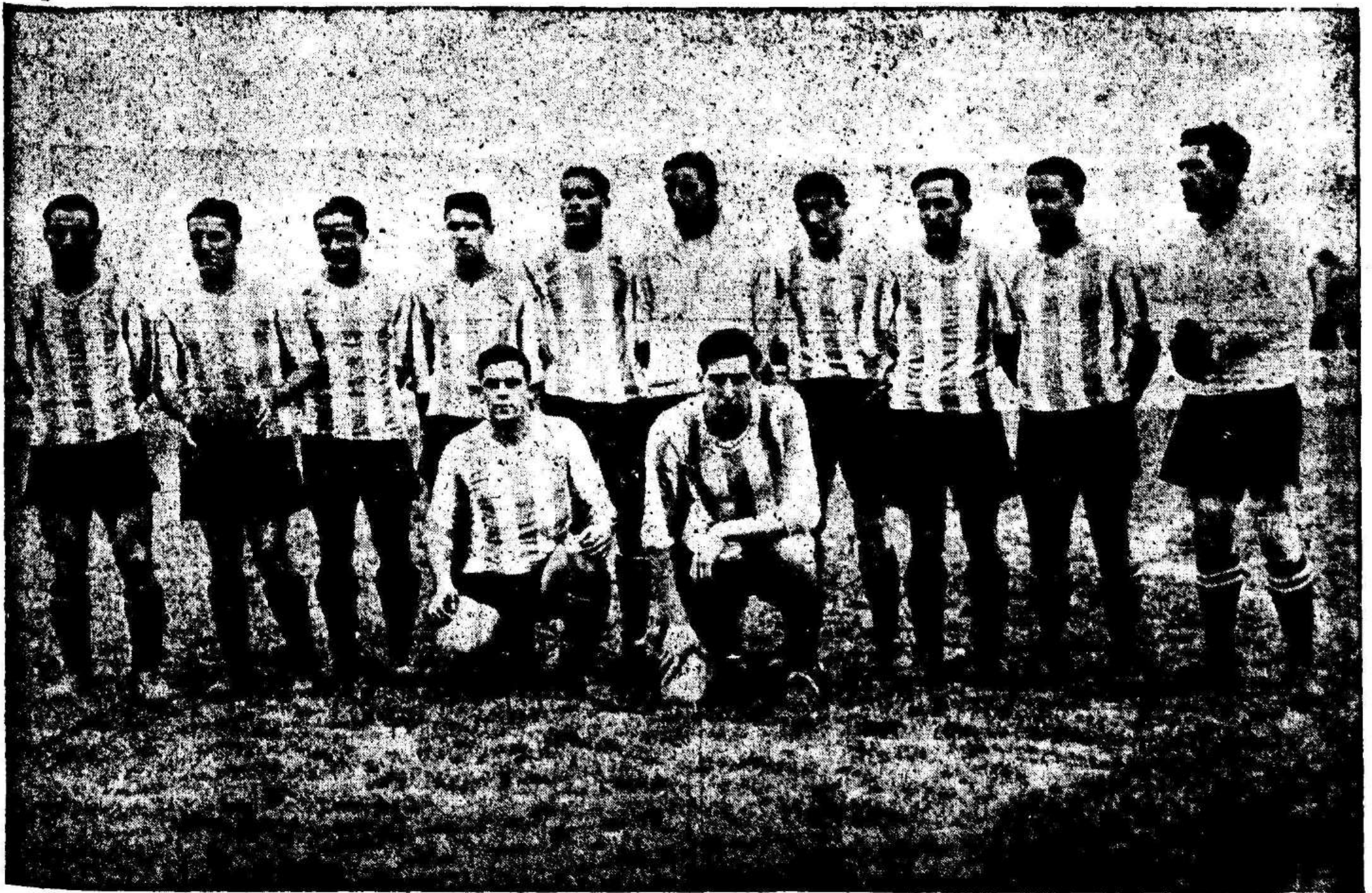
■ ■ Club Deportivo de la Coruña ■ ■