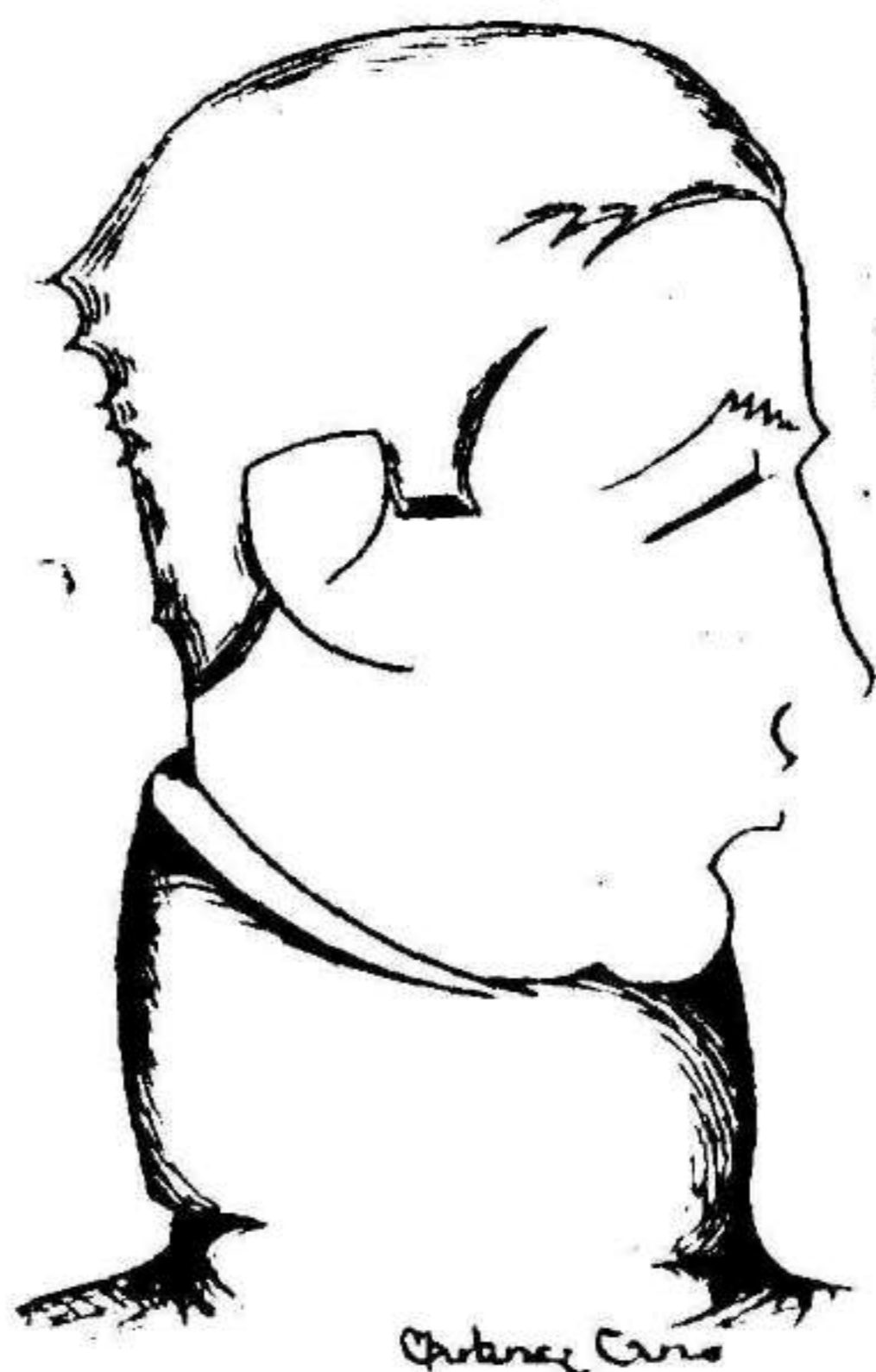
S I O N