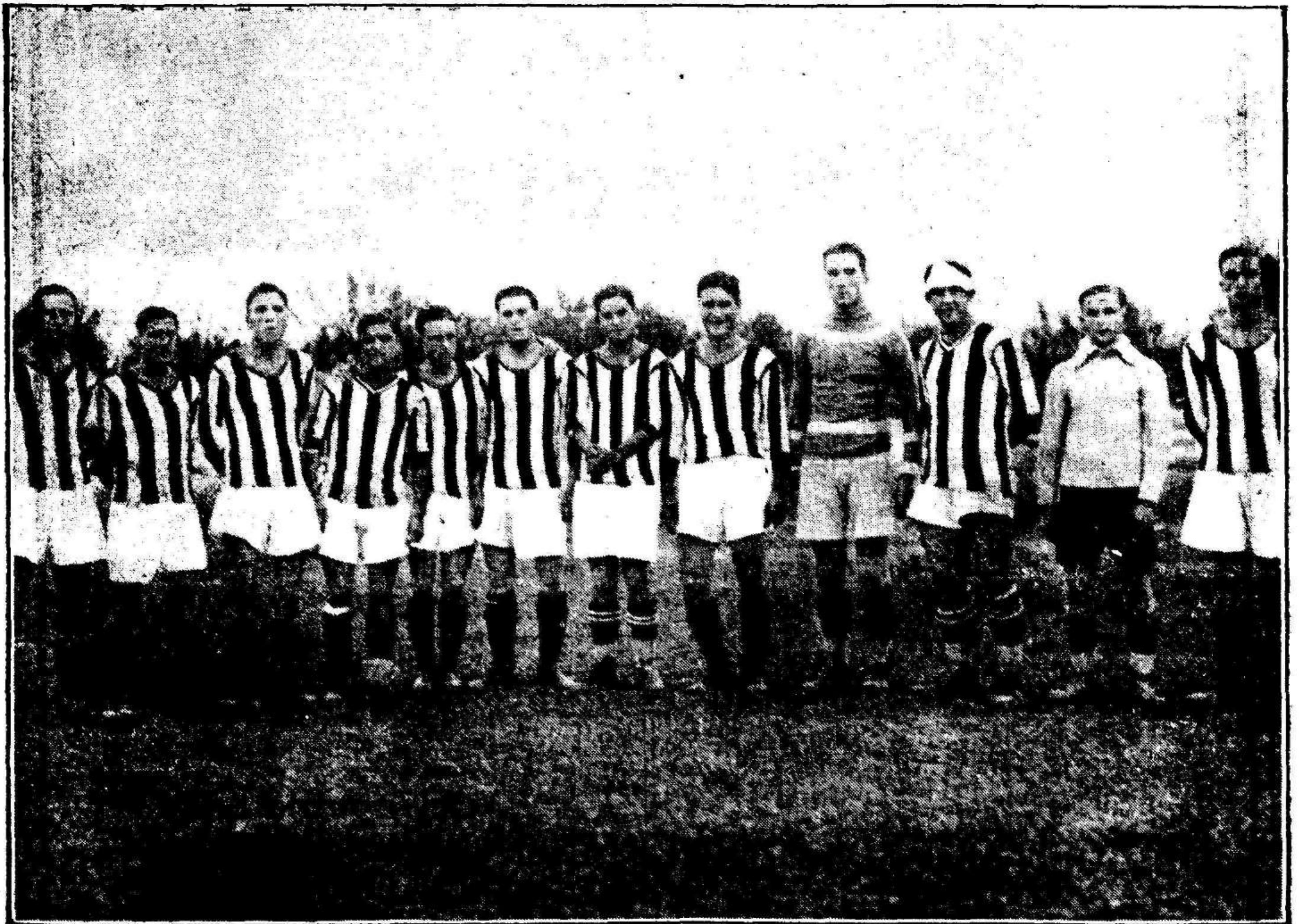
Equipo del C. D. de Castellón, sub campeón de Valencia, que ayer fué derrotado en su terreno del Sequiol, por el Real Murcia, por 3 goals a 1.