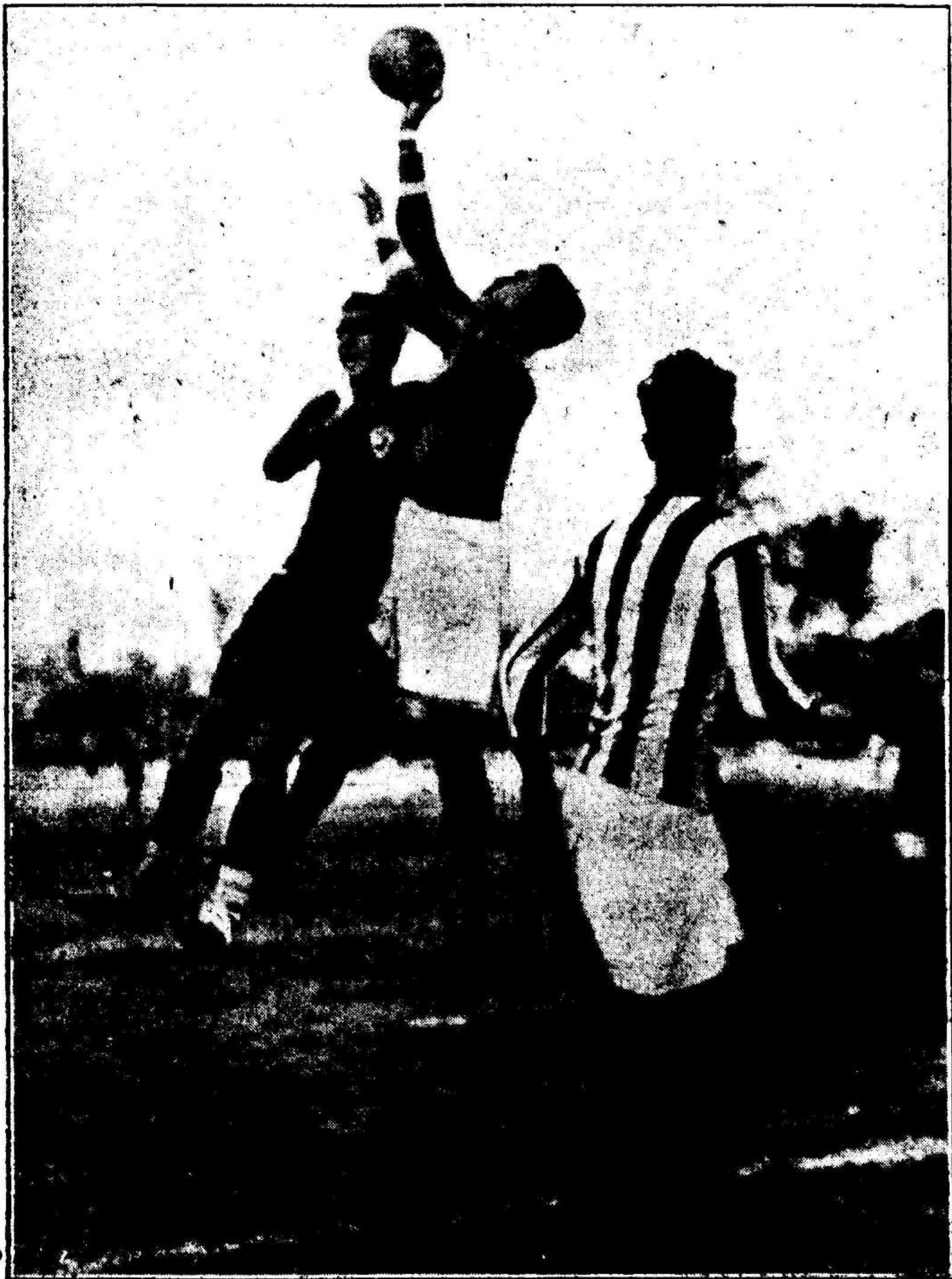
Altés, el guardameta del Castellón, acosado por el balón despeja una situación de peligro para su marco.