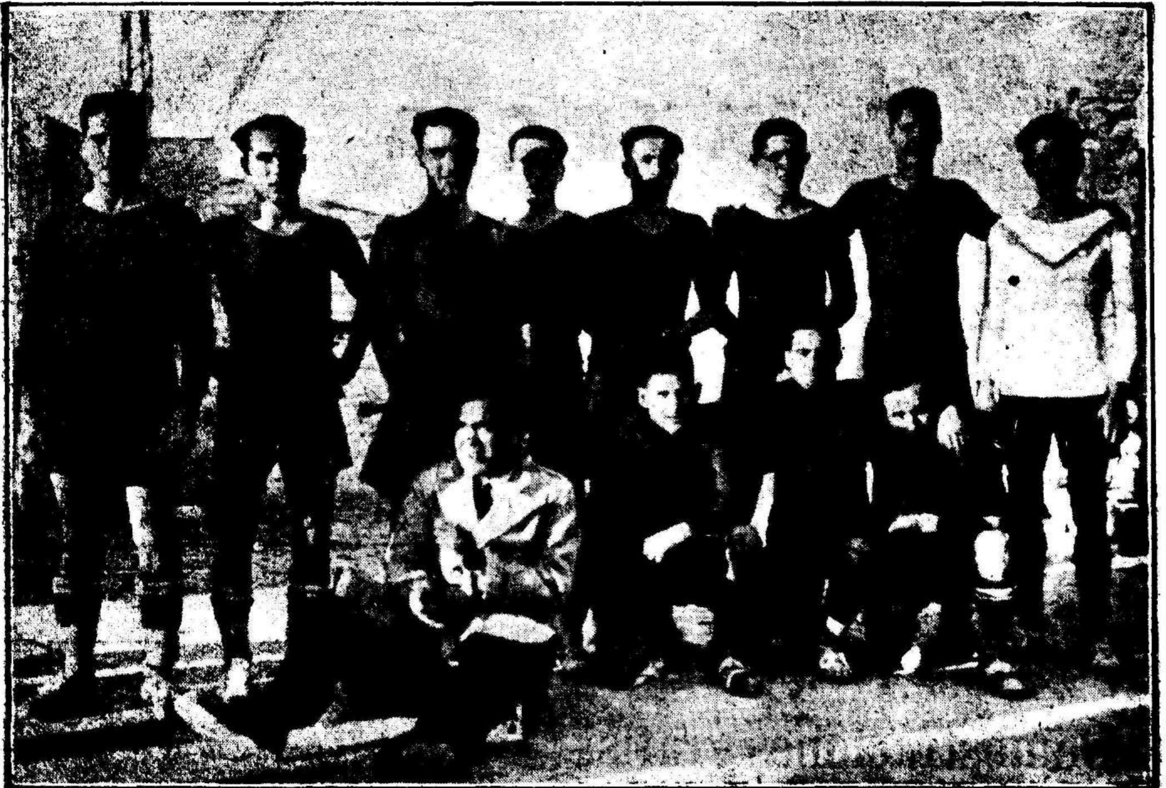
Equipo del Club Deportivo Eldense que tan brillante campaña viene haciendo en el campeonato de 2ª categoría sección A y único imbatido hasta hoy