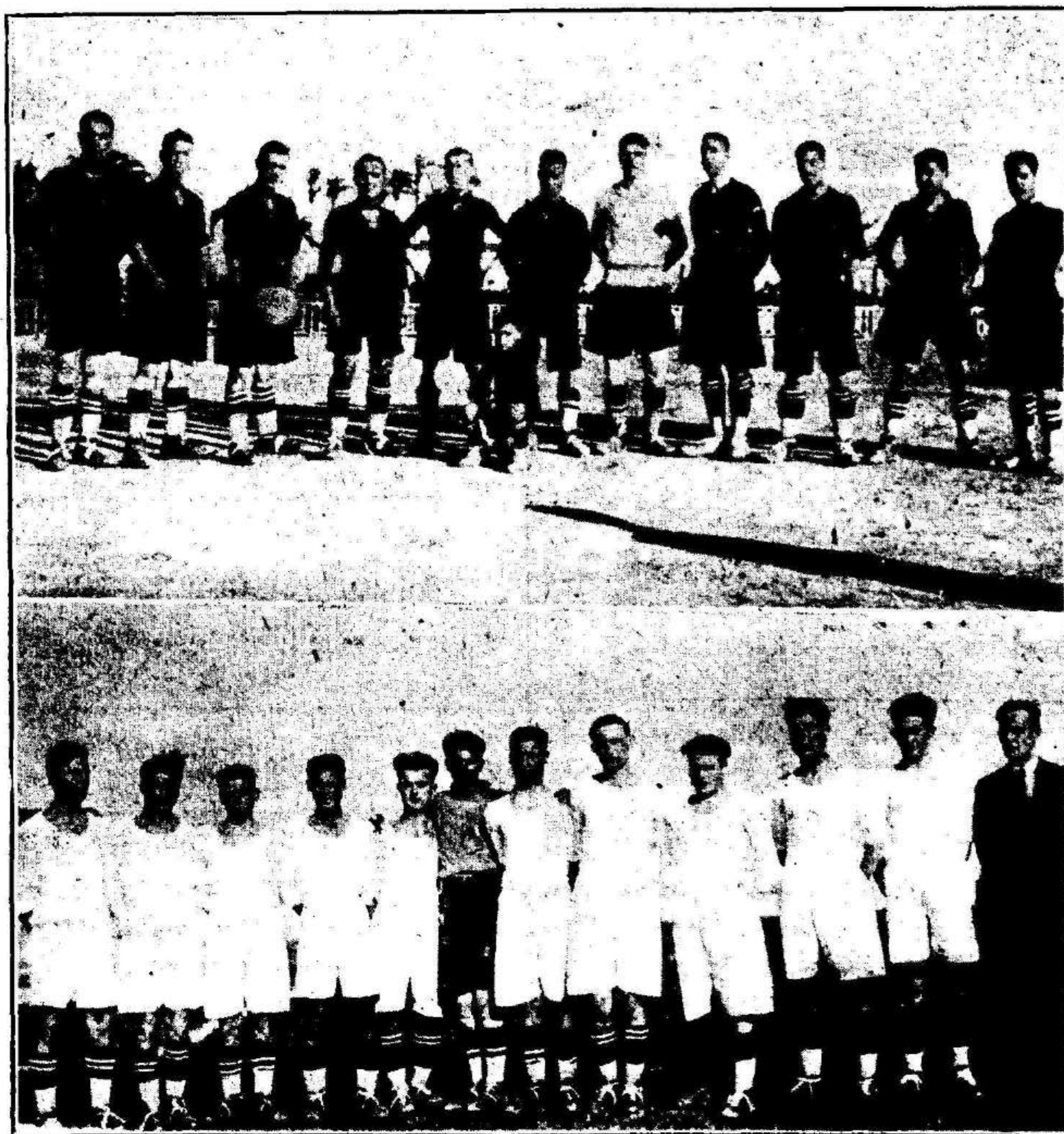
Arriba: El Imperial F. C. que ayer venció al Athlétic por 2 goals a 1, adjudicándose el título de campeón Regional del grupo B