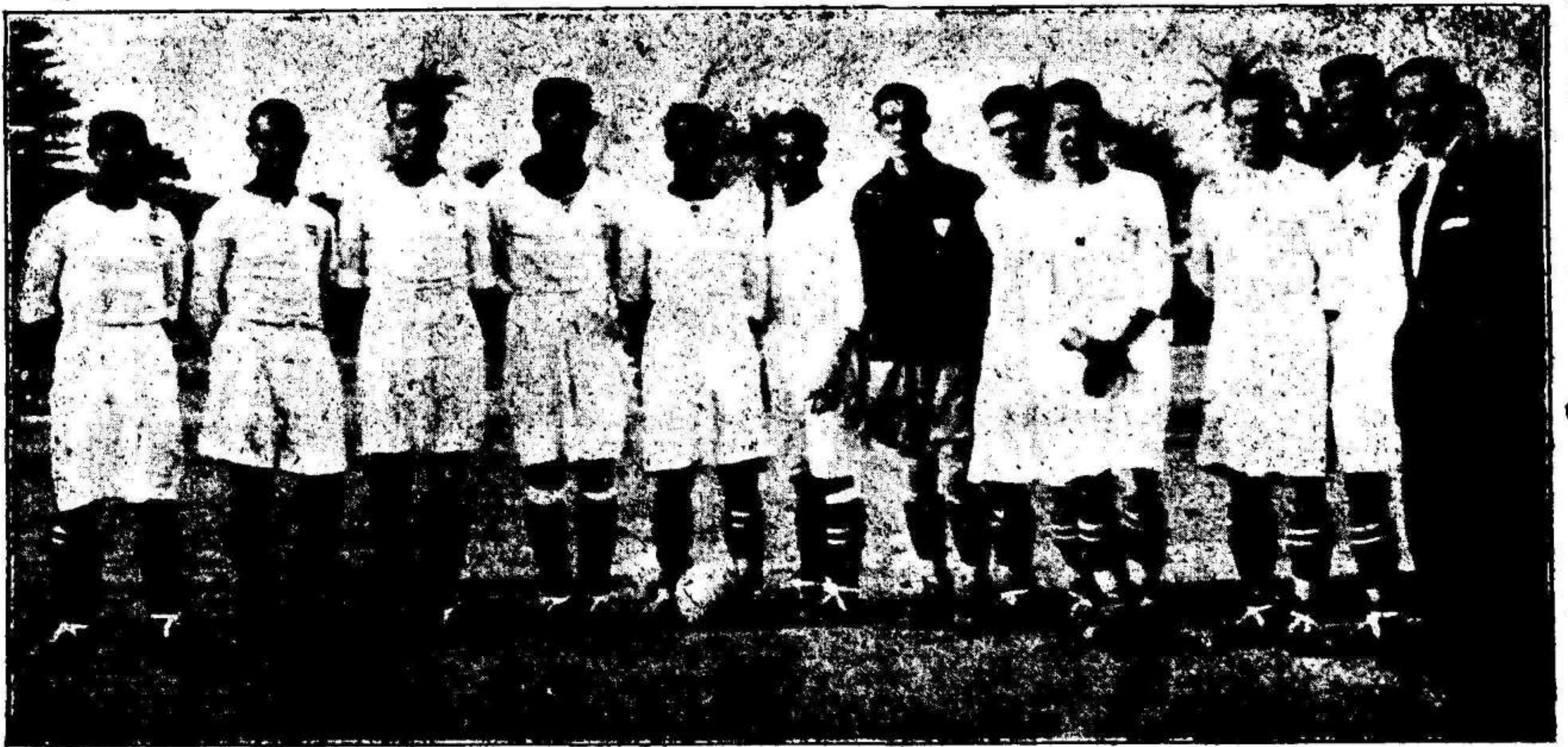
El Sevilla F. C. que ayer originó el resultado sorpresa al vencer al Español de Barcelona en Sevilla