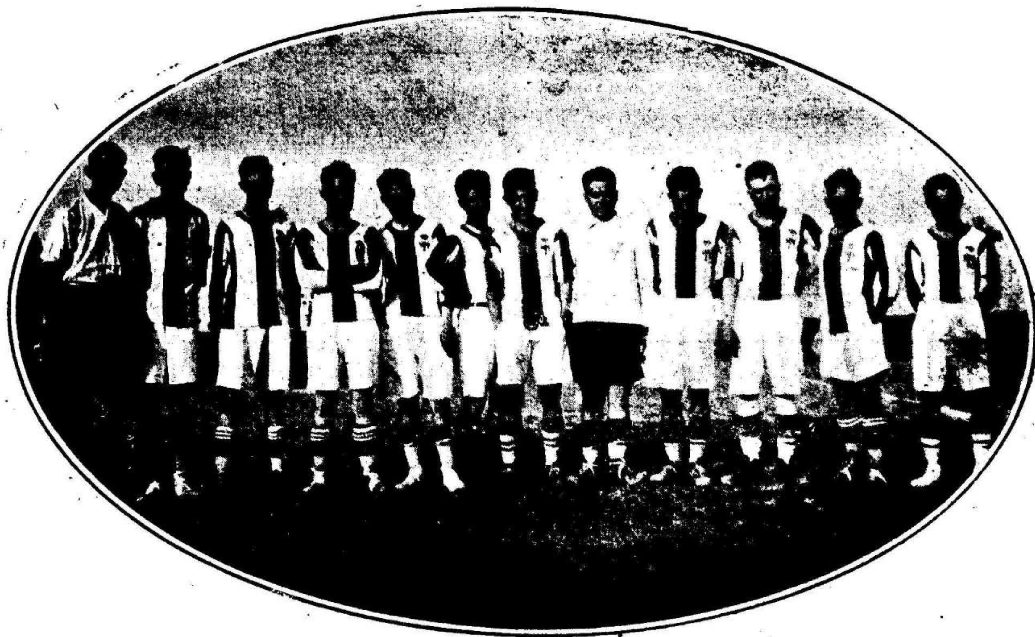
La U. D. Carthago que ayer fué vencida en Cartagena por el Real Murcia