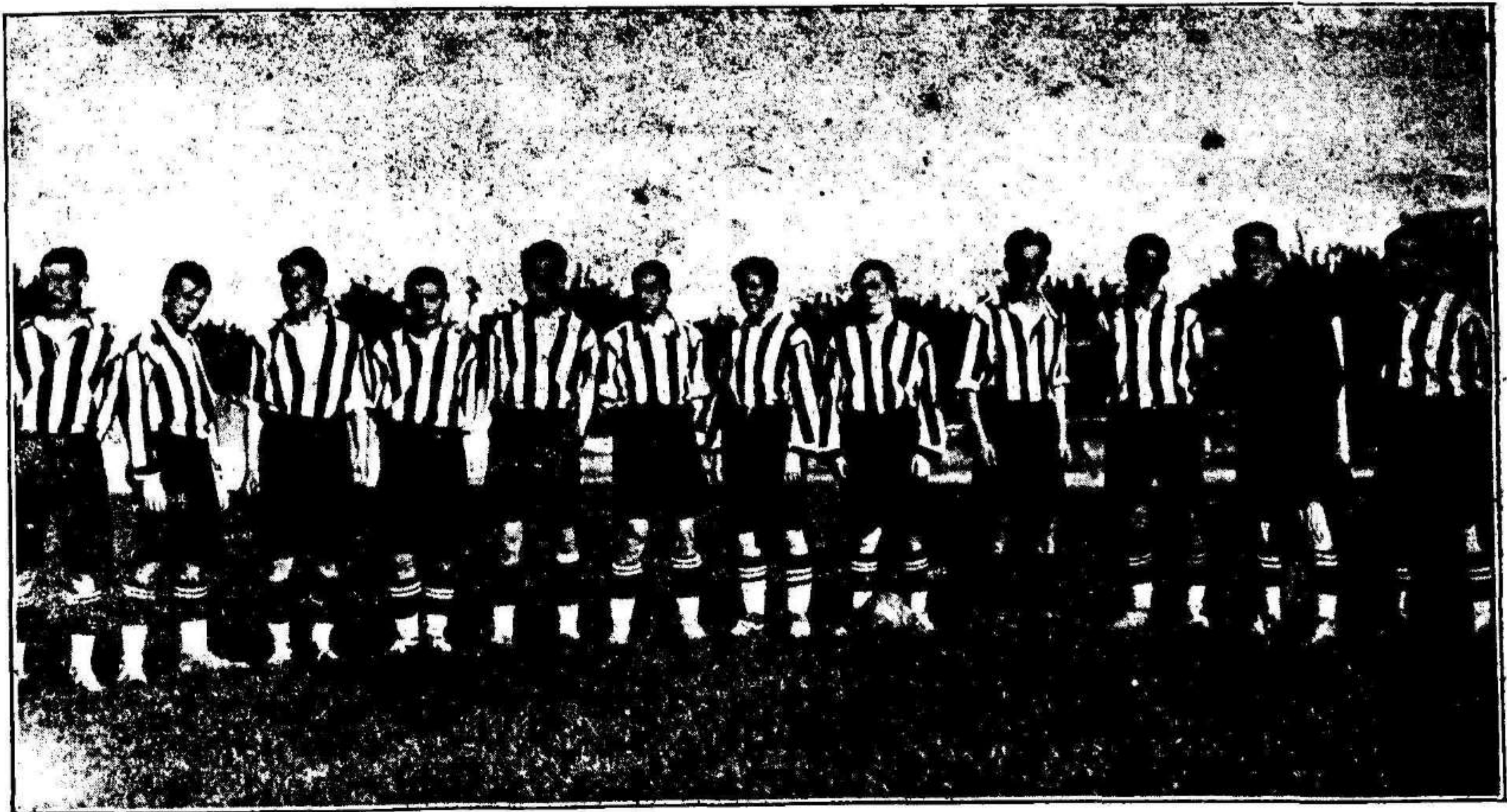
Equipo del River-Thader, que en la pasada temporada ascendió al grupo A y que ayer inauguró su nuevo terreno de juego