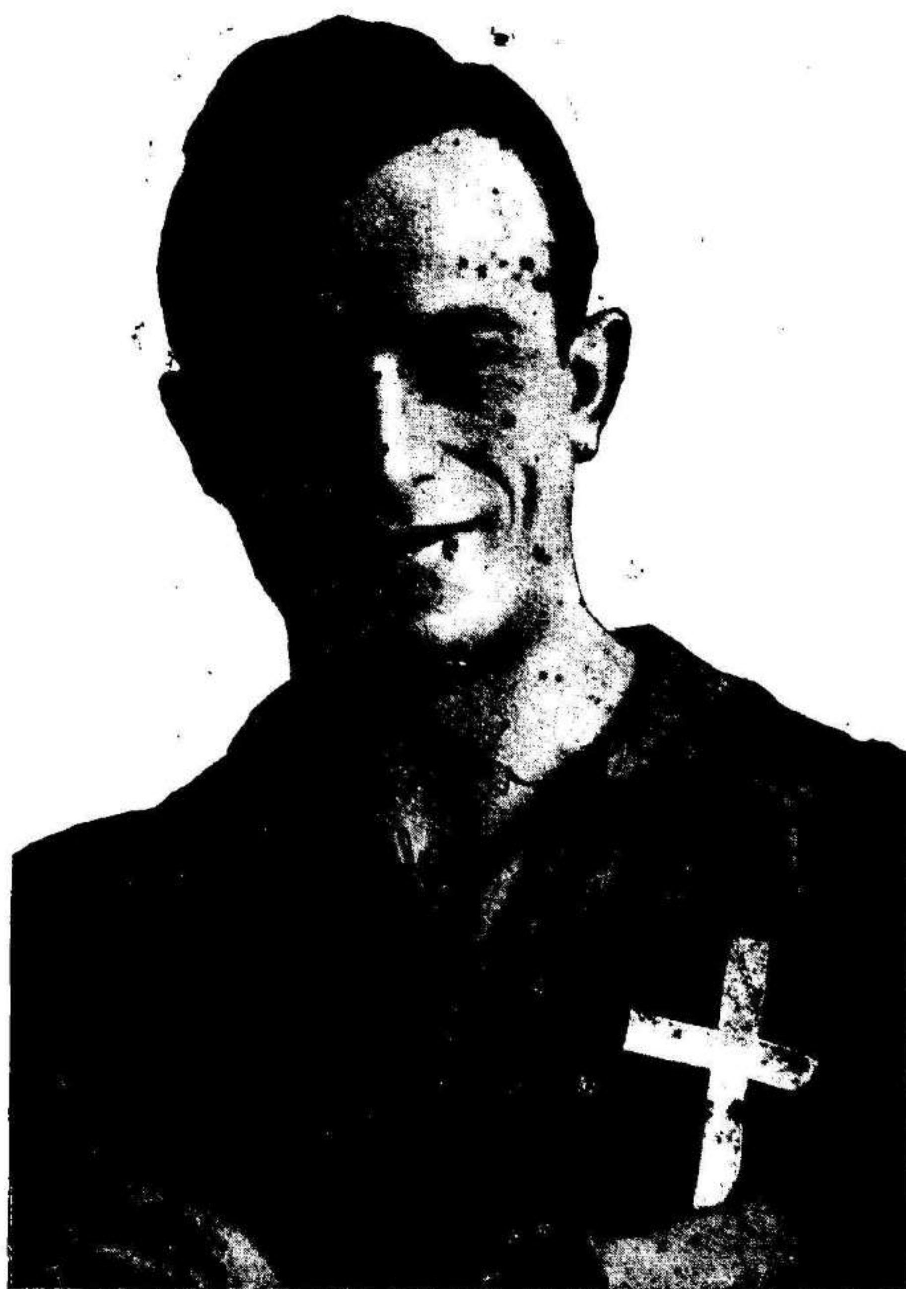
BALONCIERI , capitán del equipo Italiano que ayer batió a nuestros nacionales en Bolonia, por dos goals a cero