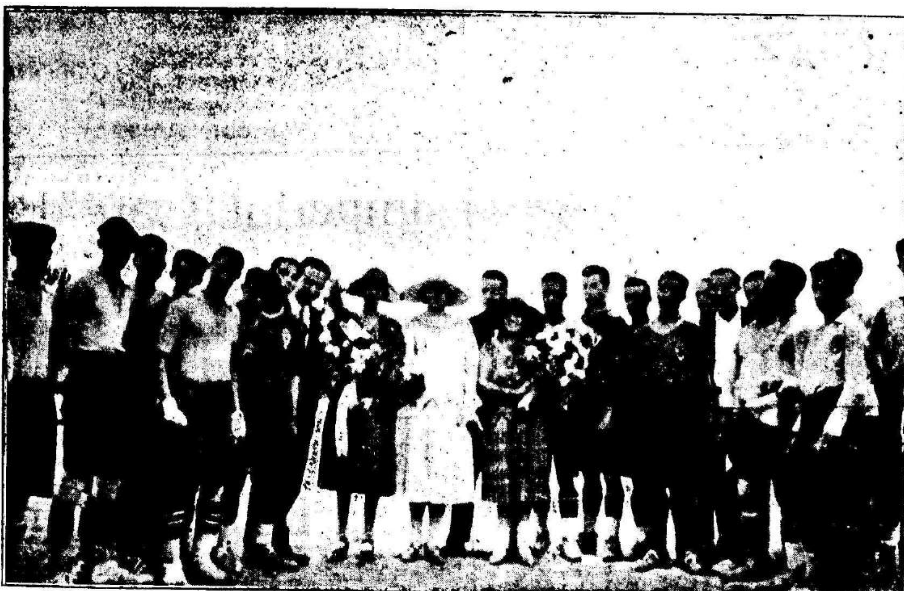
Los equipos y árbitro fraternizan antes del encuentro unidos por distinguidas señoritas lorquinas, que les obsequiaron con los simbólicos ramos