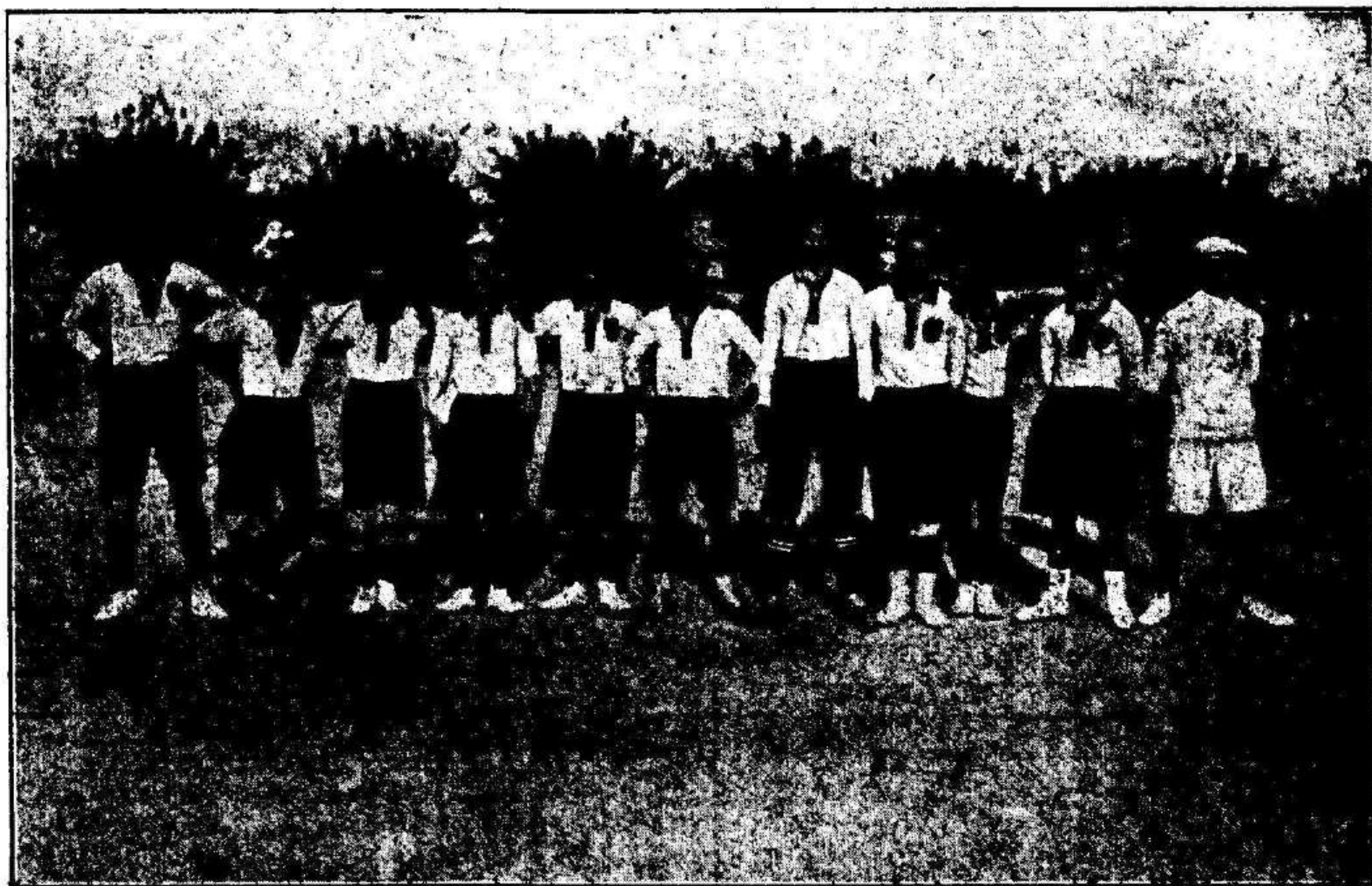
Equipo del Club Deportivo Murciano, que se adjudicó el pasado domingo el campeonato local de 2. a categoría venciendo al Ford F. C.