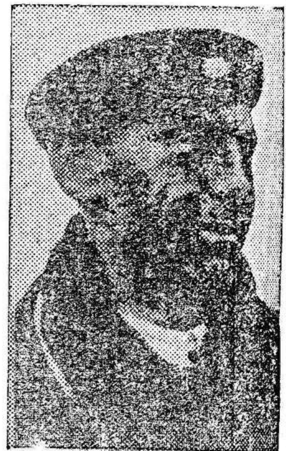
El heroico teniente coronel Ortega, nuevo director general de Seguridad