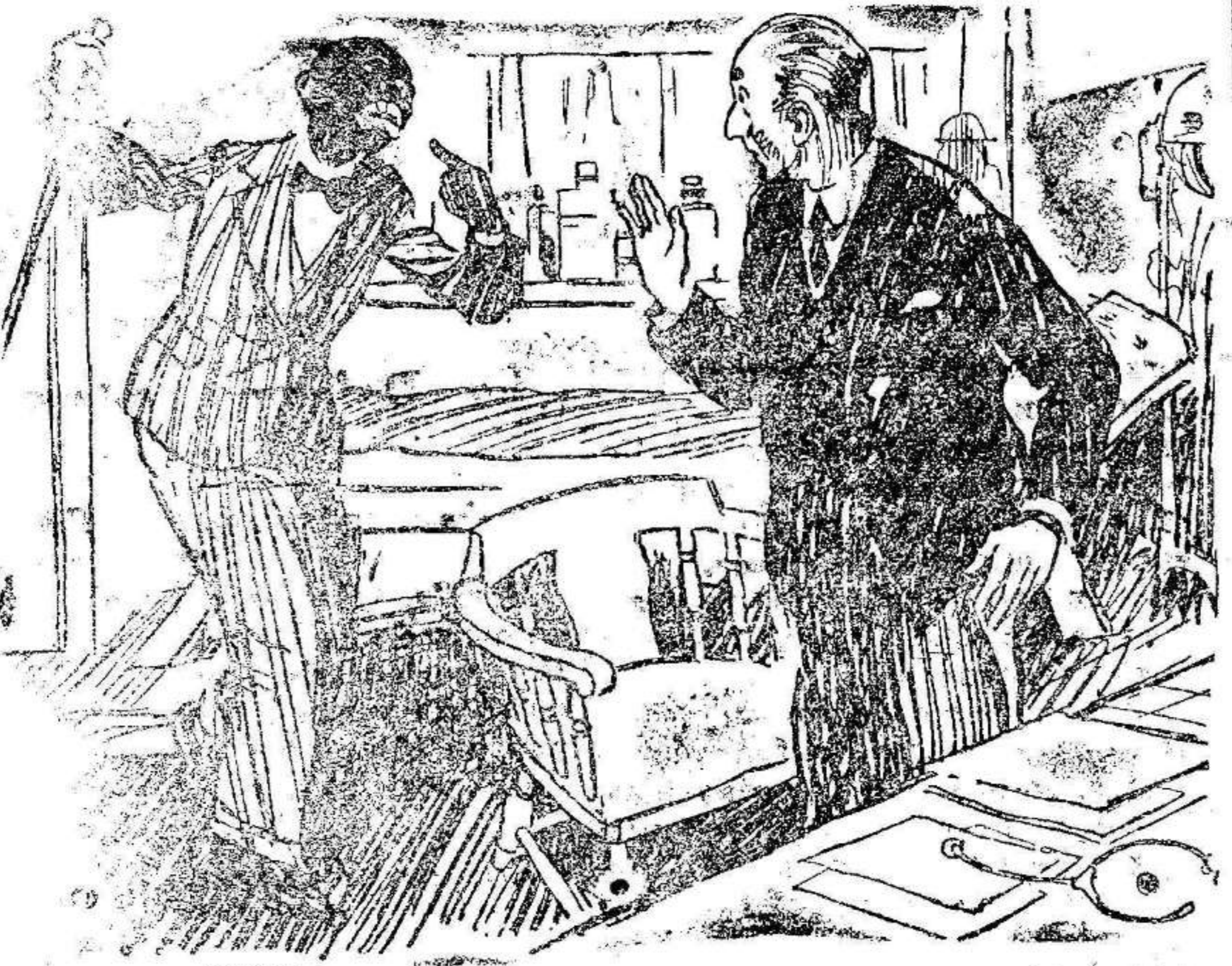
—Doctor, doctor! Que estaba tocando la ocarina y me la he [tragado] — Tranquilícese, y de la gracias a Dios que no era un piano.

Régimen de embalses del día 20 de diciembre de 1932. Pantano de la Fuensanta: Embalse, 13.954.938 metros cúbicos; desagüe, 298.156 metros cúbicos. Pantano del Talay: Embalse, 5.450.970 metros cúbicos; desagüe, 225.000 metros cúbicos. Pantano del Quijart: Embalse, 8.045.404 metros cúbicos; desagüe, 0.000 metros cúbicos.