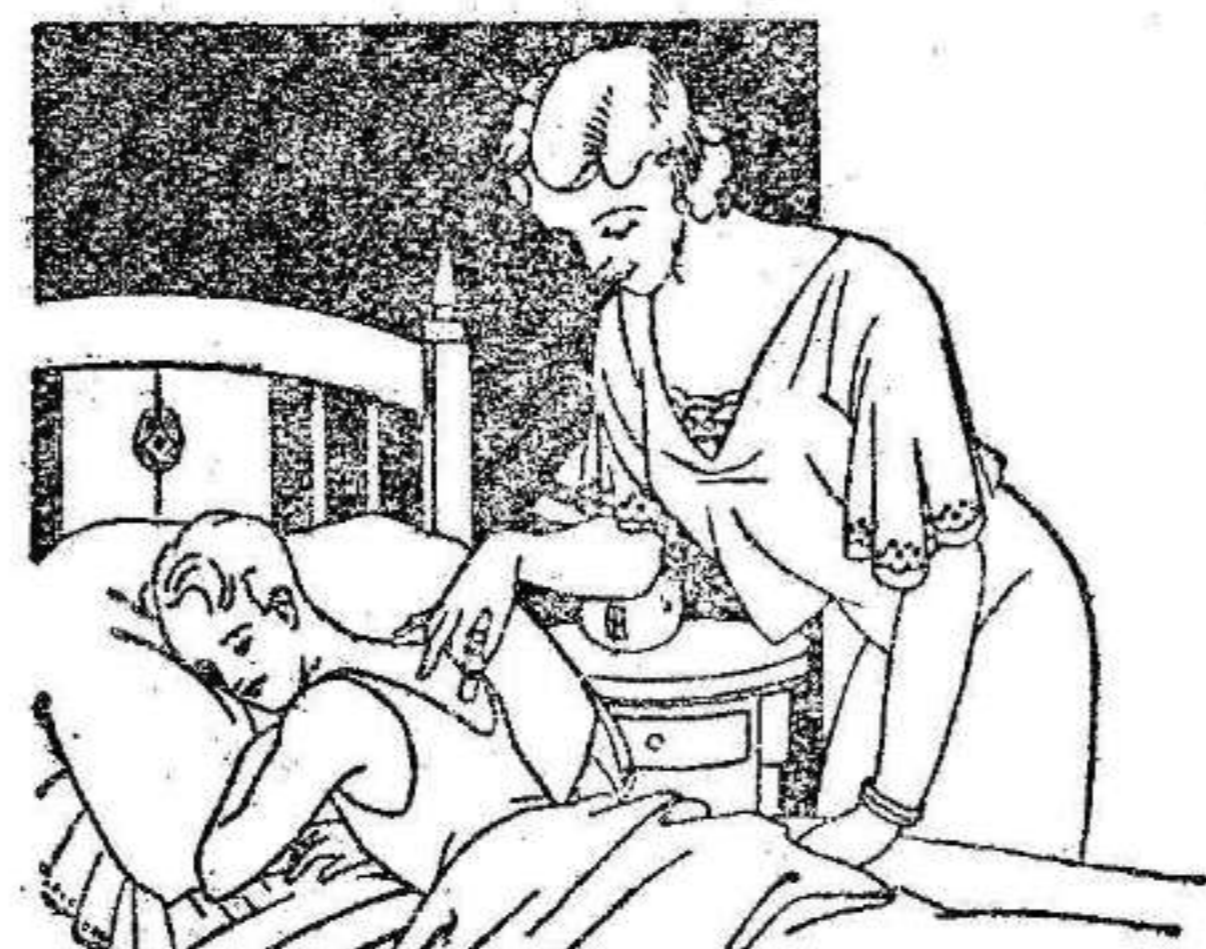
Resfriados - Asma - Pleuresías Congestión pulmonar