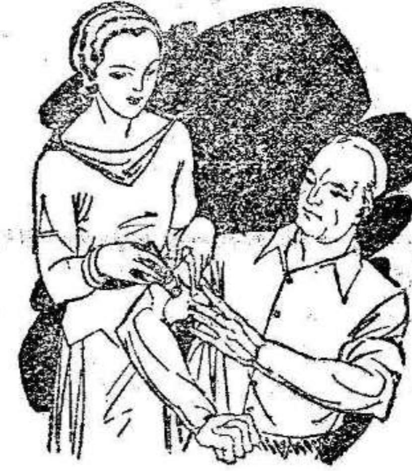
Dolor en las articulaciones Calambres

El LAPIZ TERMOSAN es el Revulsivo más práctico y eficaz contra toda clase de dolores y congestiones.