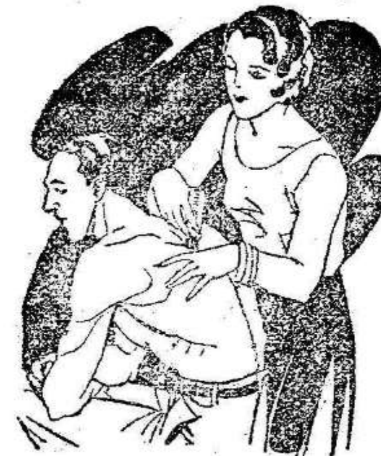
Artrismo Dolores de muñeca y brazos Dolores de espalda y riñones

El LAPIZ TERMOSAN se vende en todas las Farmacias y Centros de Específicos Tubo grande; 4.45 ptas. - Tubo pequeño; 3.- ptas., timbres incluidos