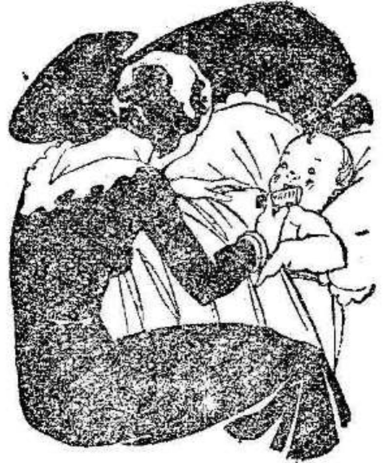
Tos - Catarros - Bronquitis Congestiones