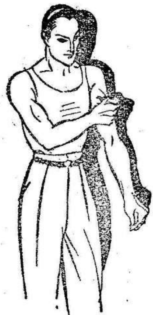
Fatiga muscular Golpes-Torceduras