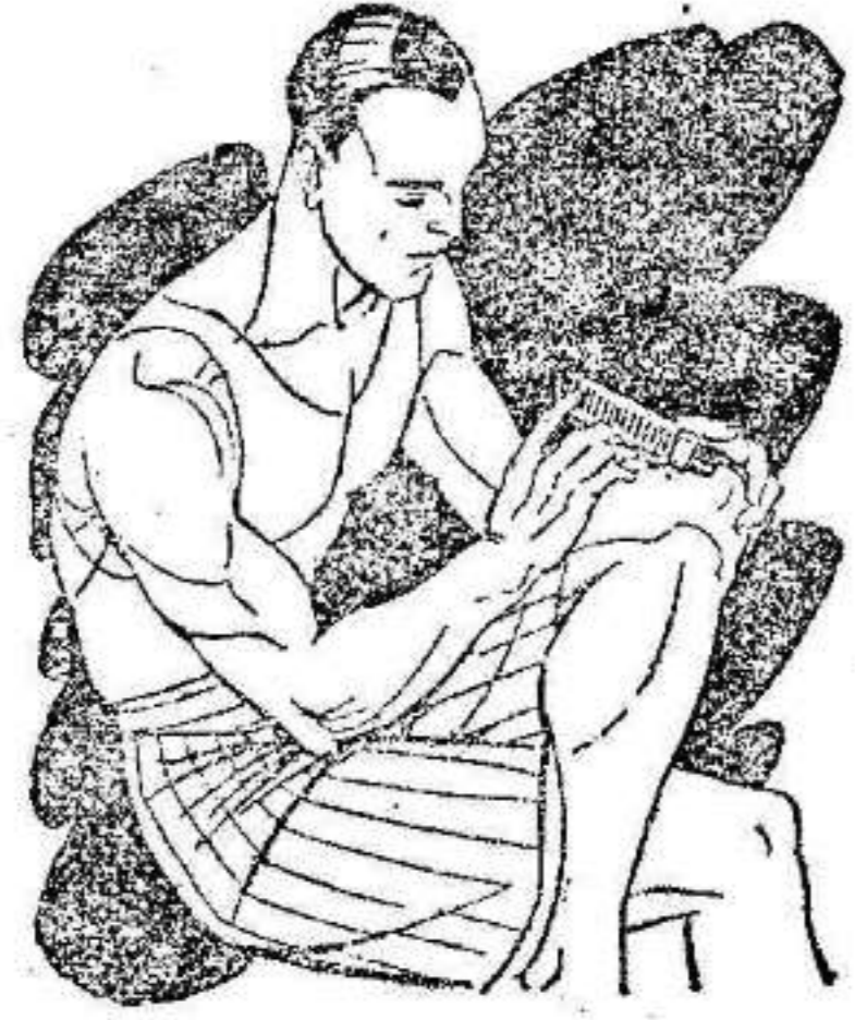
Reuma - Clática Golpes

Preparado en forma de una barrita de facilísimo empleo. Se aplica rápidamente tal como se presenta y sin tener que ensuciar-se las manos.