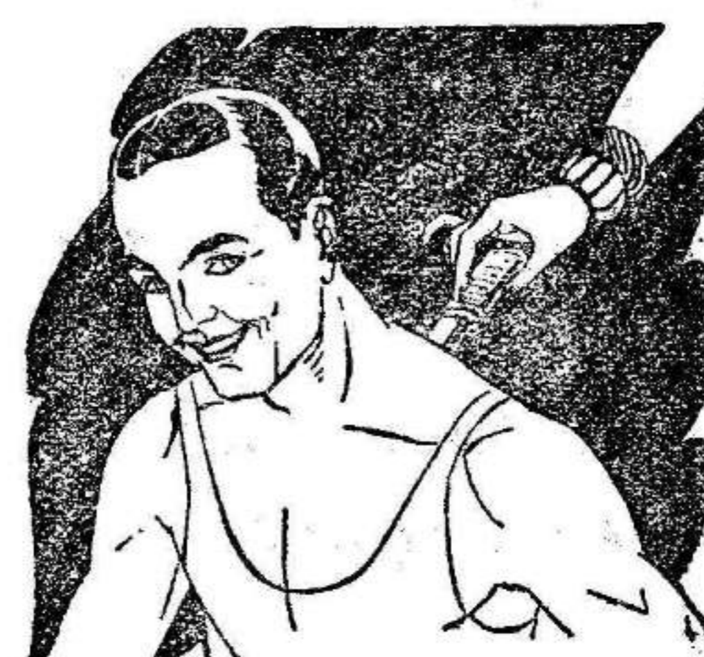
Rigidez del cuello Torticollis