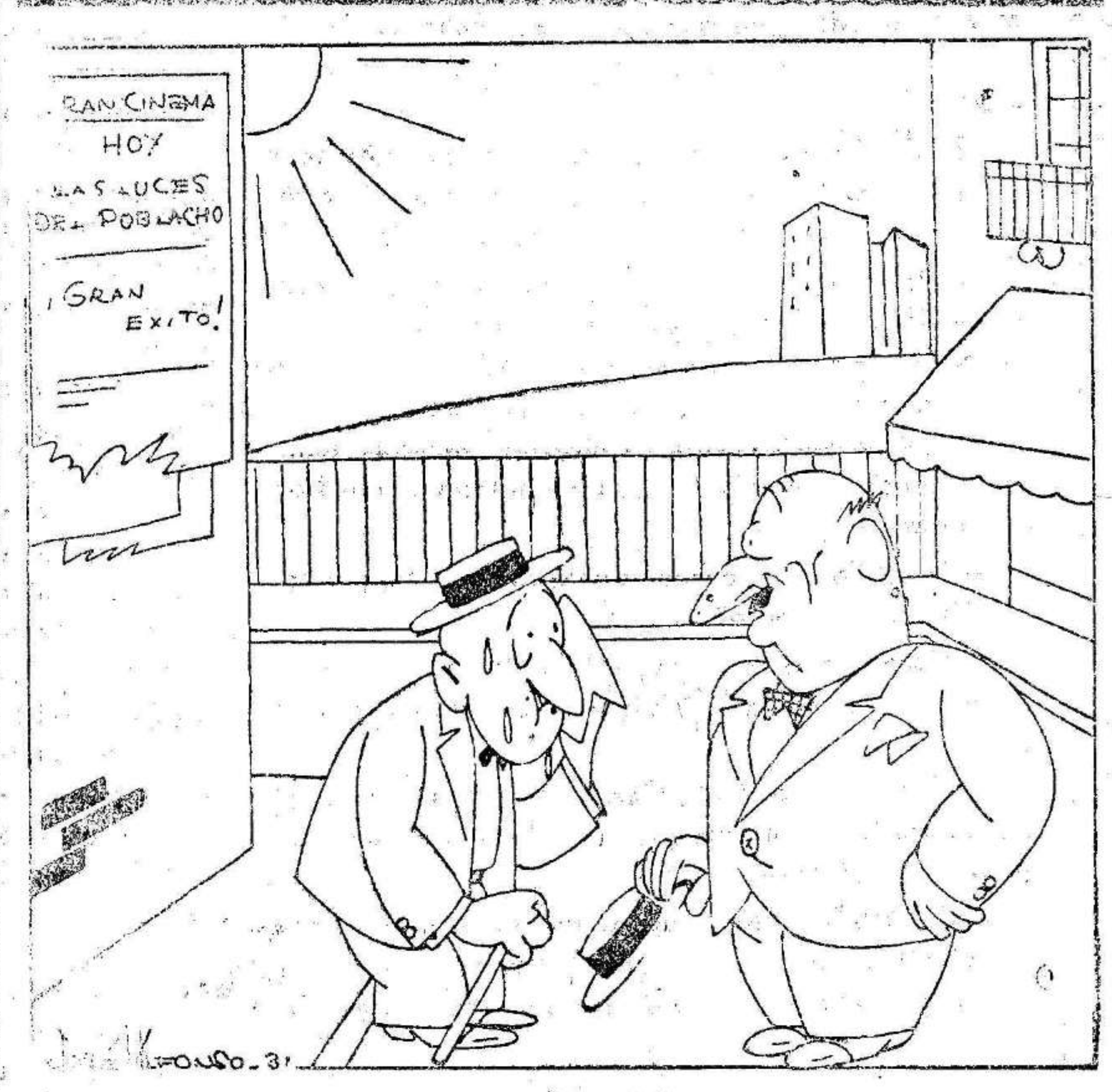
—¿Ando loco buscando un piso económico? —¿Diez reales está usted dispuesto a pagar? —Pues me parece un poquito difícil que encuentre usted un piso por diez reales... a no ser que sea uno de esos de goma para los zapatos.

Hoy a las nueve y media, de la Catedral saldrá la tradicional procesión del Corpus Christi. La procesión recorrerá la carretera de costumbres.