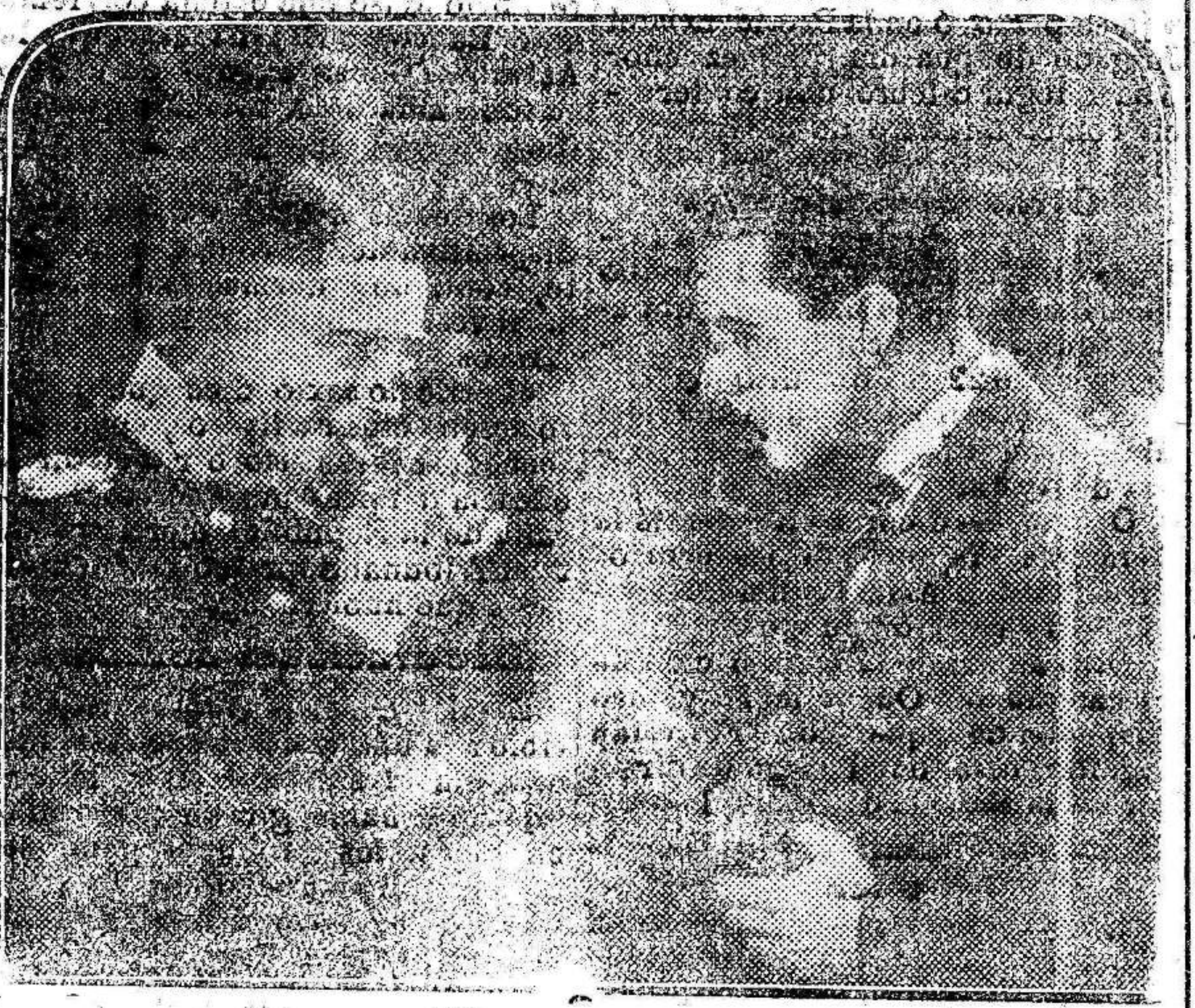
Una importante escena del grandioso film «Los ángeles del infierno».

Un problema de capital importancia, latente y reclamando su inmediata solución, está planteado: La falta de trabajo para los obreros que en huelga forzosa andan días, meses y años. Falta de trabajo que se extiende por España, pero que