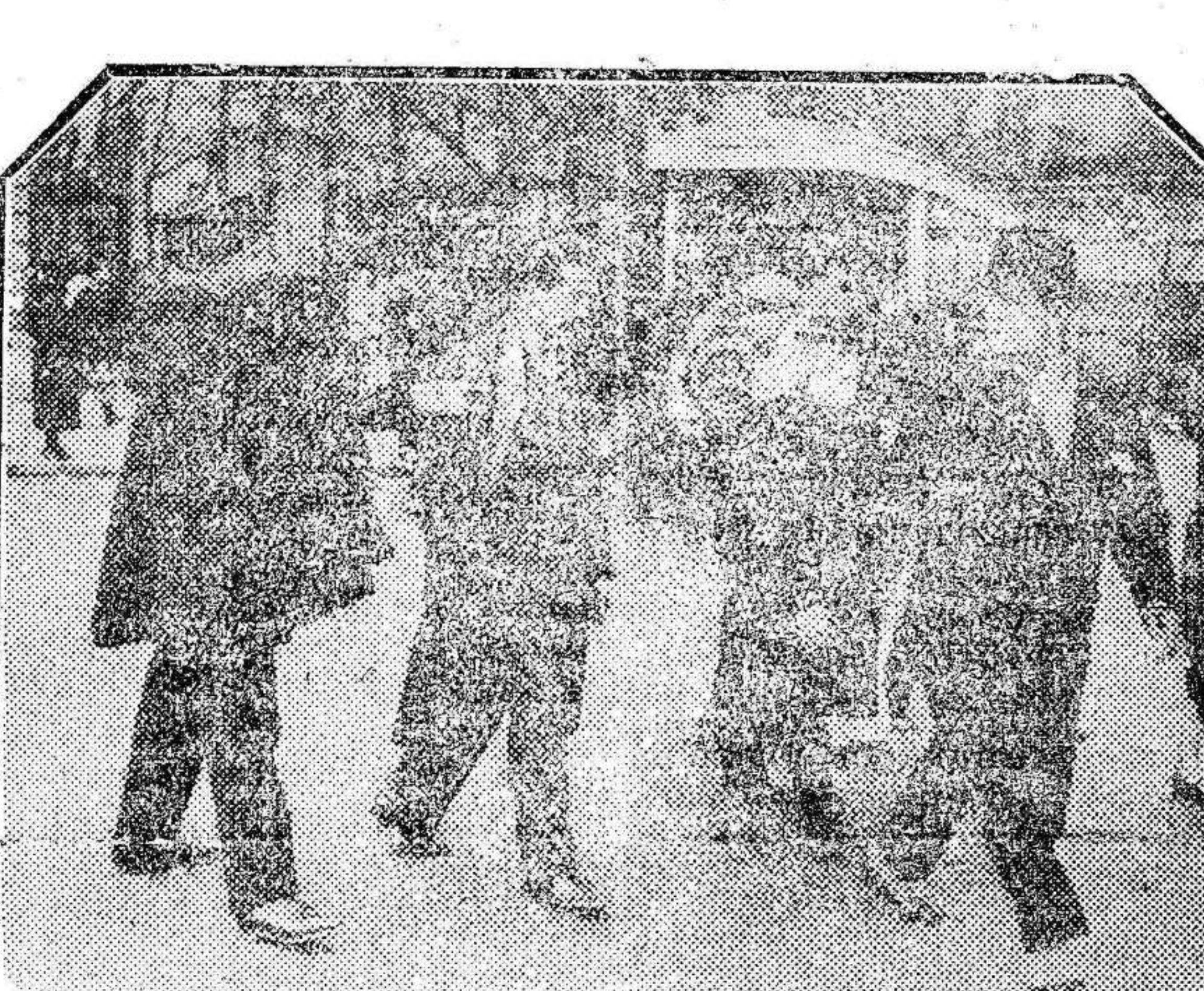
París acaba de señalar con dos líneas de gruesos y brillantes claros la forma que deben seguir los pezones para atravesar la calzada en calles de gran tránsito v-hicular. Los madrileños hace ya varios años que disfrutan de estos relativos oasis para los que no poseemos automóvil, mientras los parisenses están aprendiendo a andar como es debido, bajo la mirada vigilante y el dedo imperativo de los «sergenis de ville».

El excoronel Maciá ha dirigido un expresivo telegrama de felicitación a don Niceto Alcalá Zamora.