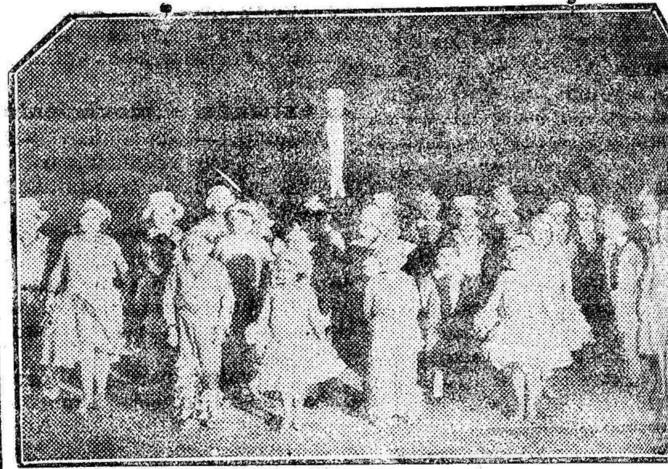
En la Sala de Milán se ha presentado una compañía de liliptenses que cantan maravillosamente diversas óperas, y en la cual hay, además de excelentes tiples y sopranos, magníficos barítonos y tenores. En cuanto a bajos, los habrá, como es lógico, insuperables.

La Fiesta del Gay Saber será sin duda la más suntuosa de cuantas fiestas se han celebrado en el coliseo municipal.