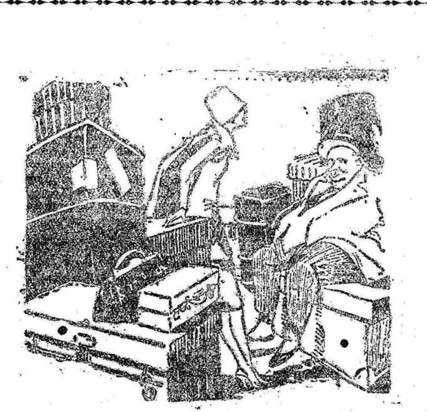
ELLA.—¿Y cómo le has traído a mamá nada menos que dos chales? EL.—Porque le oí decir que daría por uno media vida.