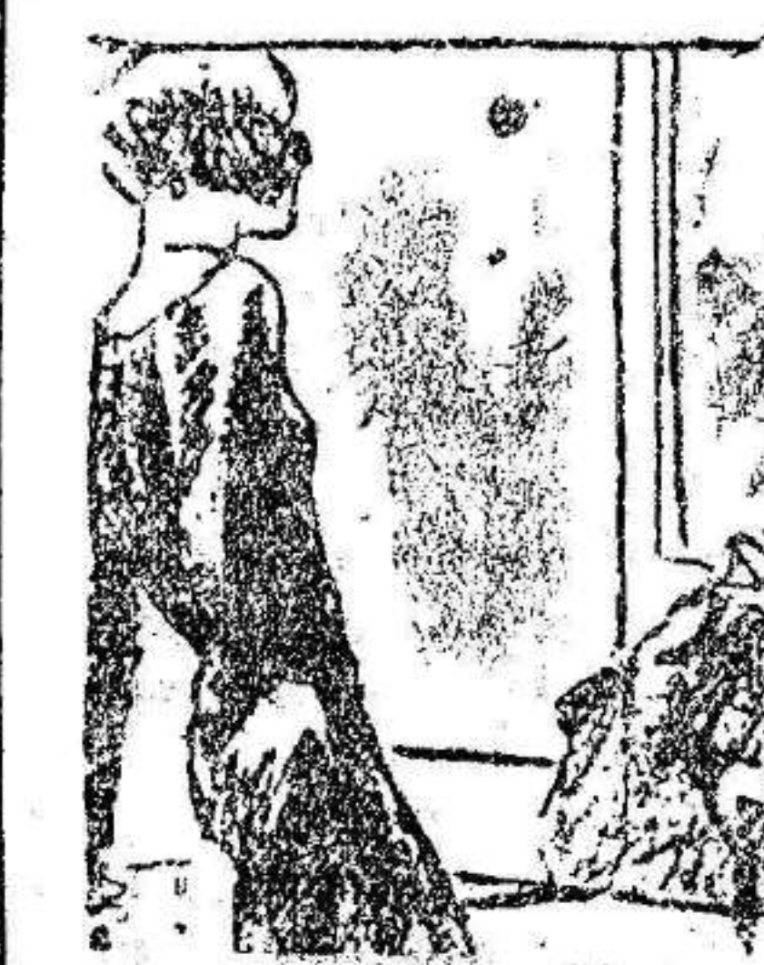
EL JEFE.—Se llama usted mecanógrafa, y resulta que no sabe colocar la cinta a la máquina.

Finalmente todos los académicos se ponen en pie para retirarse, y Pradera da por terminado su discurso.