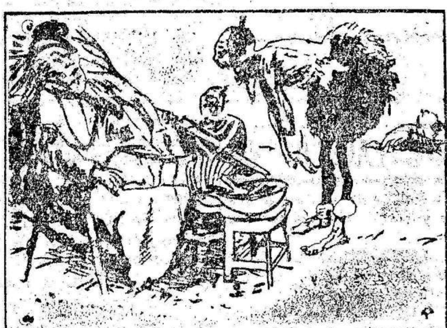
EL REY CANIBAL.—¿Qué hay de comer? SECRETARIO.—Chofer asado. —¿Y para la servidumbre? —Neumáticos a la vinagreta.