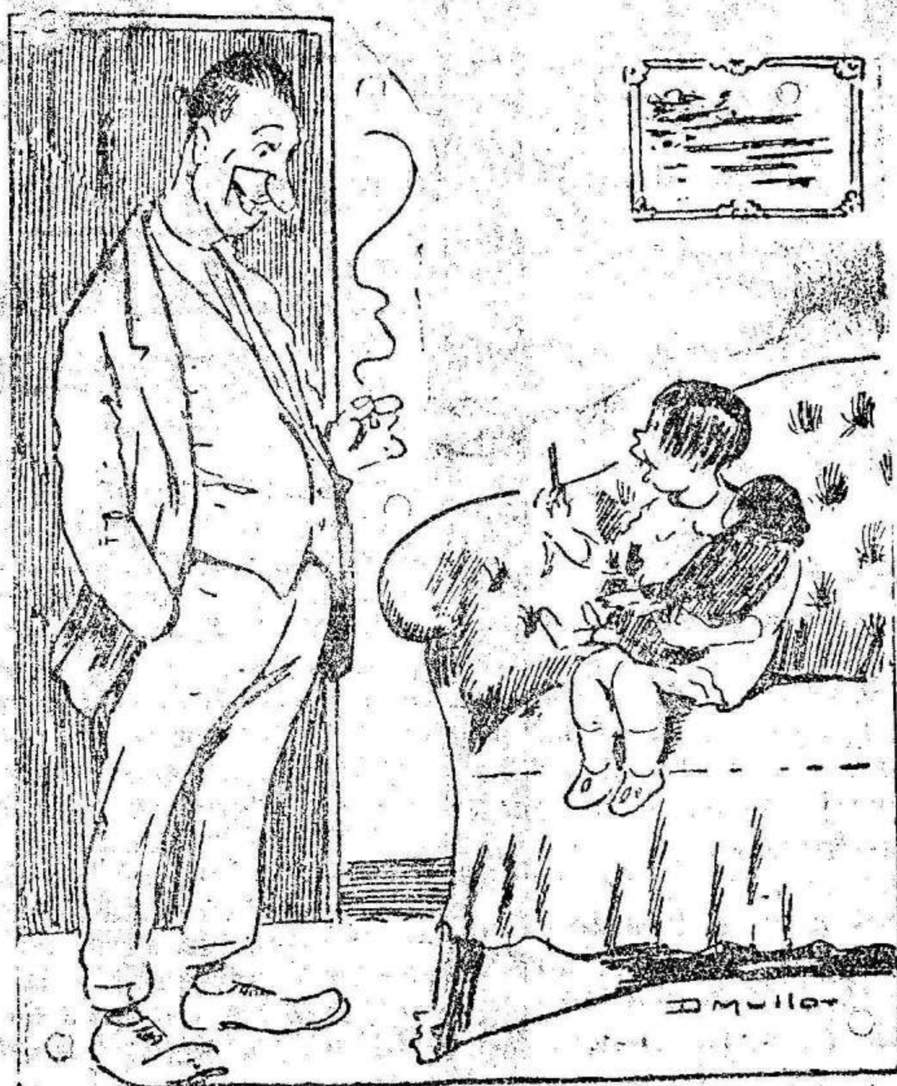
—Papaíto, lo he puesto el termómetro a la muñeca porque tiene fiebre. —¿Y cuánto marca? —Las siete menos cuarto. («La Unión Mercantil».)