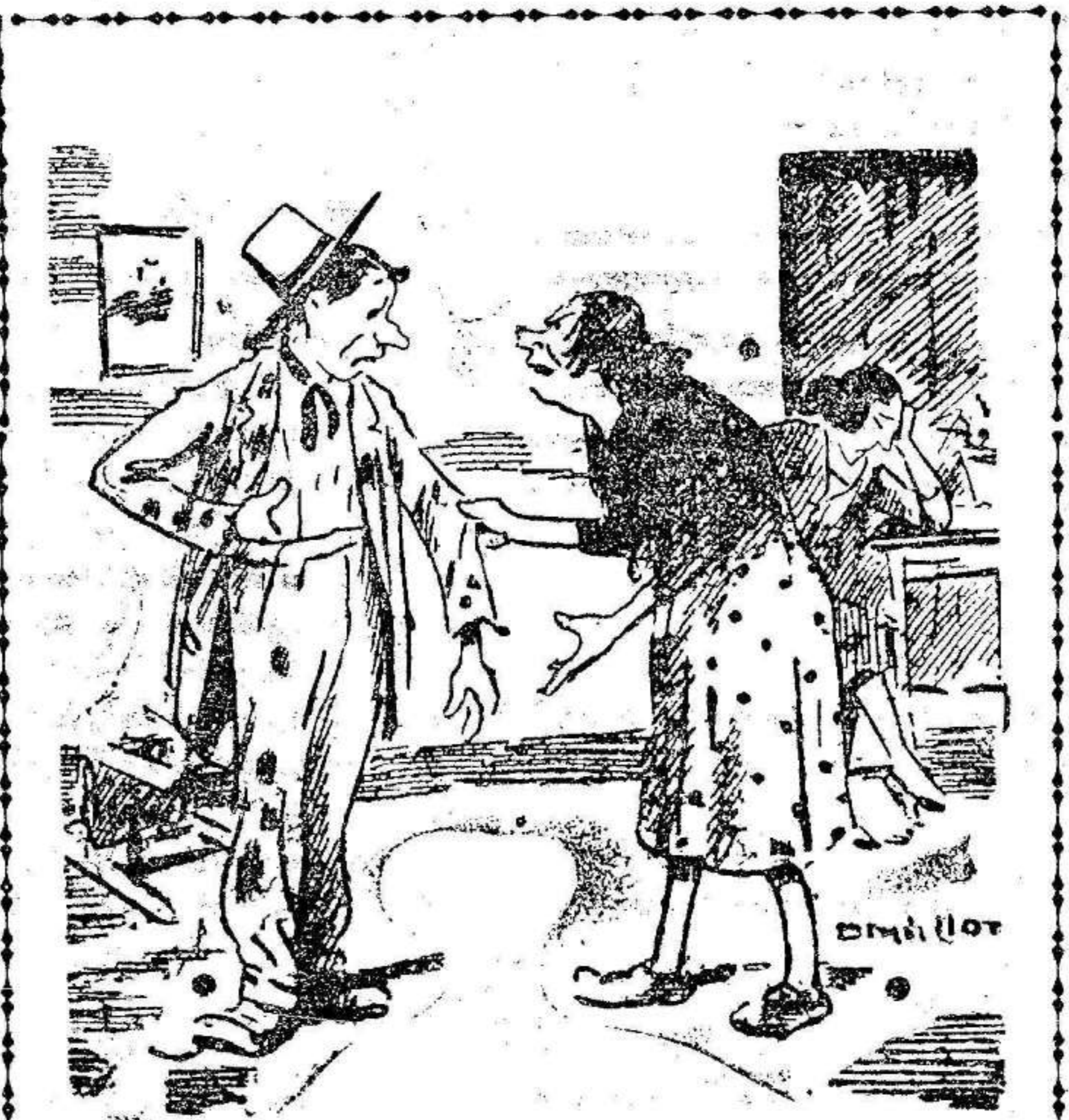
—Señora, el arrepentimiento lava «toas» las manchas. —Bueno; quien se tiene que arrepentir es tu traje...