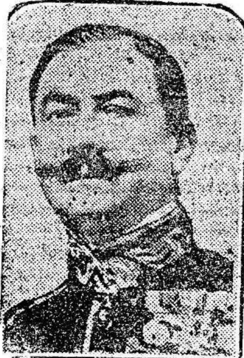
D. DÁMASO BERENGUER PRESIDENTE DEL GOBIERNO

Añadió que dejaba con pena esa casa a la que podía asegu-