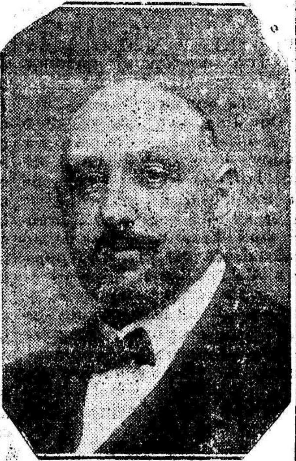
Don Angel Ossorio y Gallardo ILUSTRE ABOGADO

Según los partidarios de la primera opinión los ejemplos de Rusia e Italia, son suficientemente elocuentes para demostrar el fracaso de la ideología política de la libertad. Veamos si esos casos son excep-