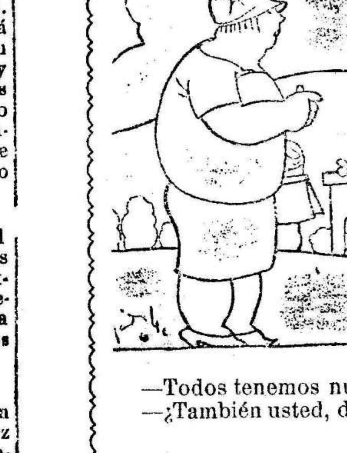
—Todos tenemos nuestro flaco, Gorito. —¿También usted, doña Flérida?

«Atrofia el civismo, hace del Estado un gran sindicato de egoísmo, recluye al ciudadano en sus negocios e intereses personales; con lo que agrava la crisis en que se ha originado. Favorece la prevaricación porque, aun esforzándose a una tarea heroica, la integridad y la vigilancia del dictador no puede suplir la coacción fiscalizadora del Parlamento, de la Prensa y de la opinión libre.